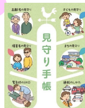
東広島市見守りサポーター 名前

見守りのポイントや気になるサインは、「見守り手帳」を参考にしてください。 つなげる相談機関は、最終ページの相談機関一覧をご覧ください。 なお、相談機関では、通報いただいた方の事をお話することはありません。