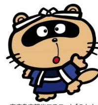
東広島市観光マスコット「のん太」