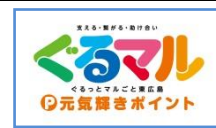
元気輝きポイントマーク