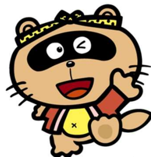
東広島市観光マスコット「のん太」