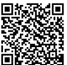
アクションプラン

「遊び 学び 育つひろしまっ子!!」推進プラン(第2期) (令和4年3月 広島県、広島県教育委員会)