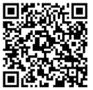
レベルアッププラン