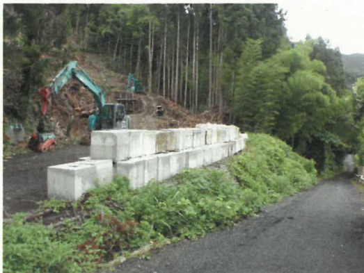
【コンクリートブロックや大型土のうによる堰堤】