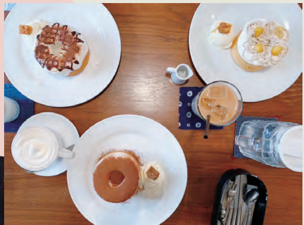
2 cafe TrecaSa

明治末年に建てられた建物をリノベーションした古民家カフェ。シフォンケーキがおすすめで、季節ごとに種類が多彩です。JR西条駅周辺は酒蔵巡りをしたり、カフェ巡りを楽しめます。