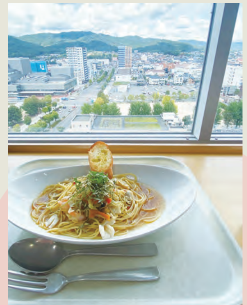
4 ビストロパパ市役所店

東広島市役所10階にある食堂レストラン。イタリアン・洋食を中心に、東広島の食材を使った地産地消メニューが豊富。食事をしながら西条の町並みや、酒蔵が一望できて、市民も利用できます。