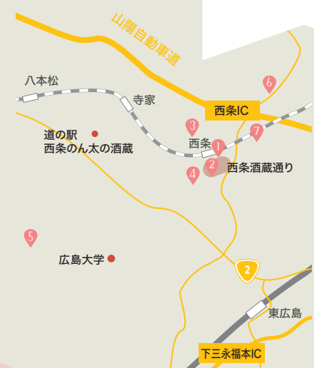
1 賀茂鶴酒造の酒蔵