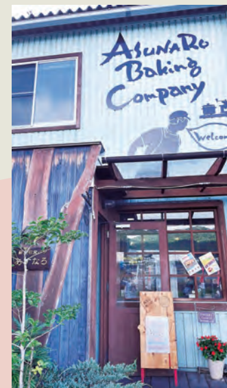
7 あすなろベイキングカンパニー本店

西条土与丸に2011年にオープンしたパン屋。お気に入りにはクロックムッシュでカリッとした耳とふわふわのパンと濃厚なソースとの相性が良く、訪れる度に買っています。