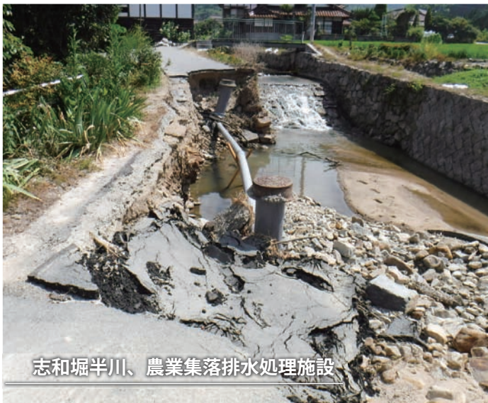
志和堀半川、農業集落排水処理施設