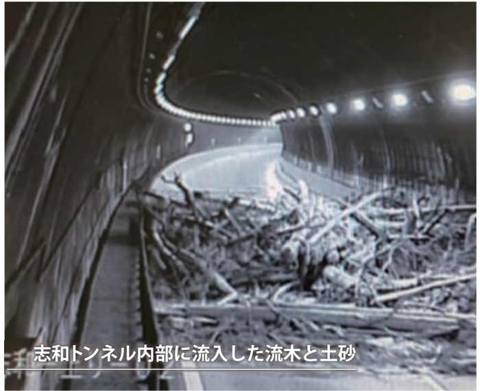
志和トンネル内部に流入した流木と土砂