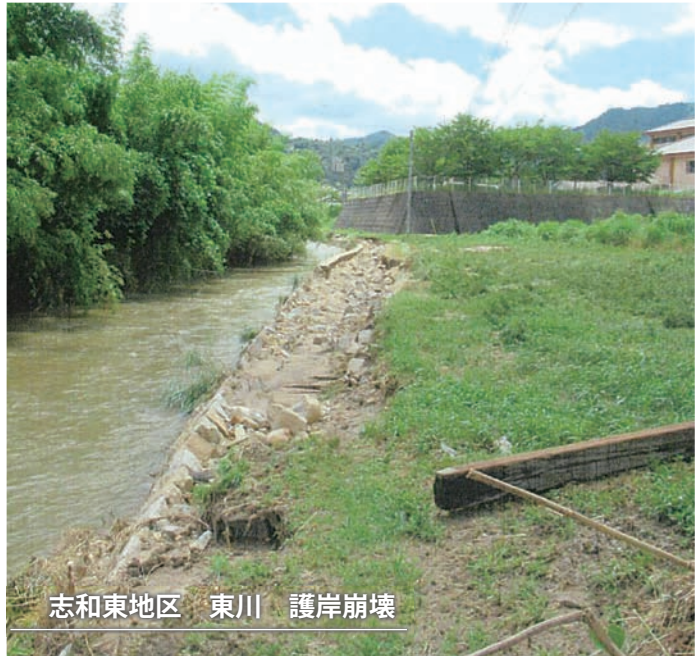
志和東地区 東川 護岸崩壊