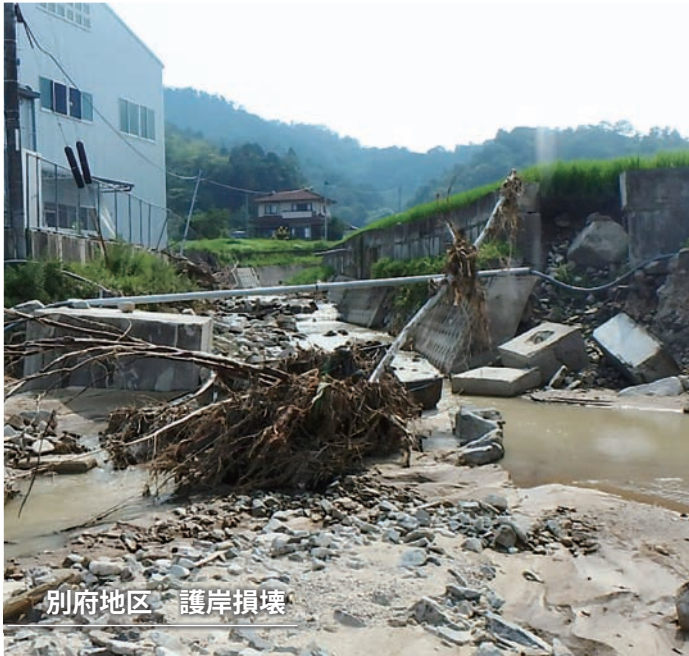
別府地区 護岸損壊