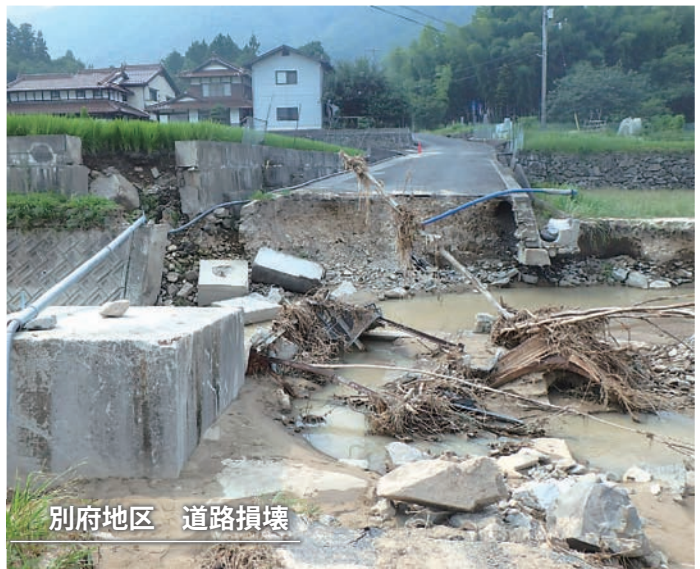
別府地区 道路損壊