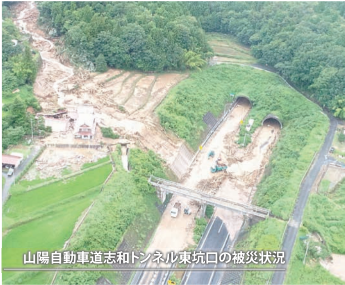
山陽自動車道志和トンネル東坑口の被災状況