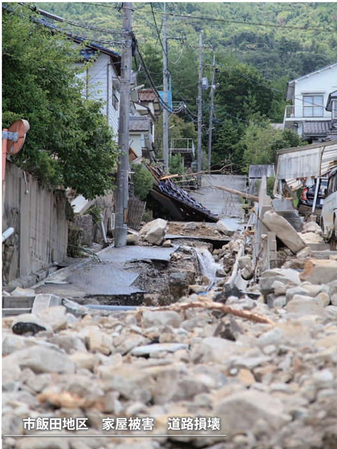
市飯田地区 家屋被害 道路損壊