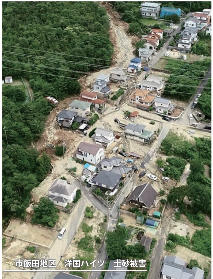
市飯田地区 洋国ハイツ 土砂被害