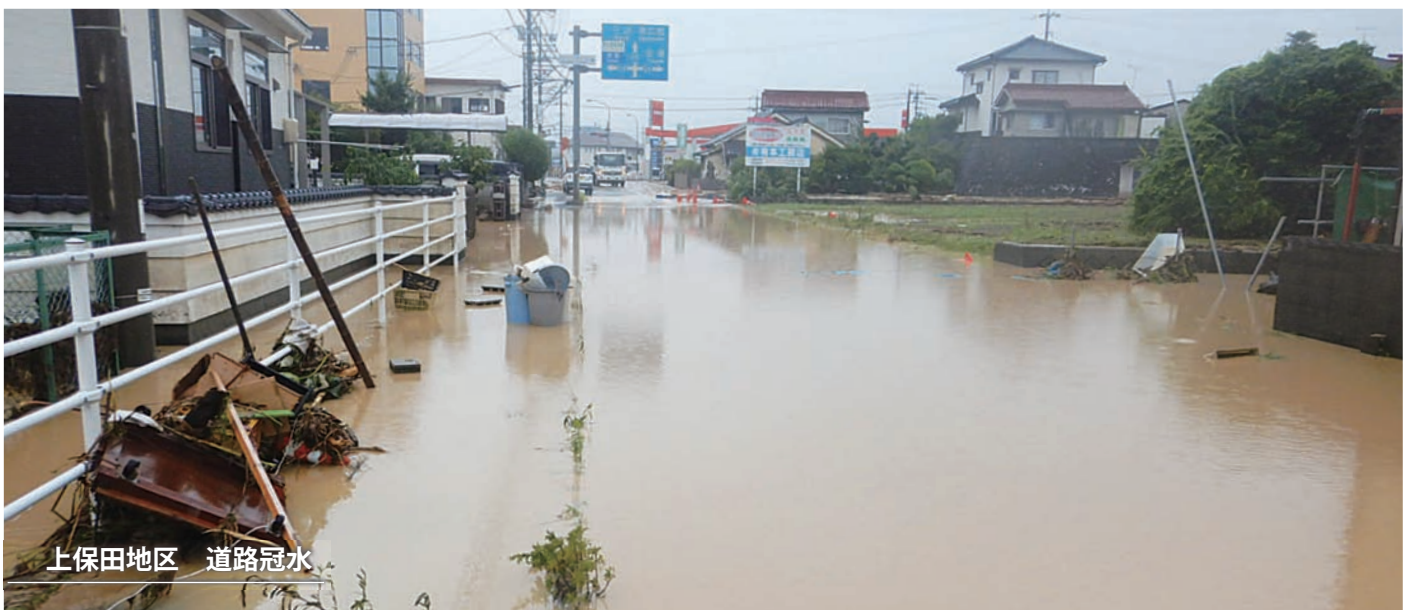
上保田地区 道路冠水