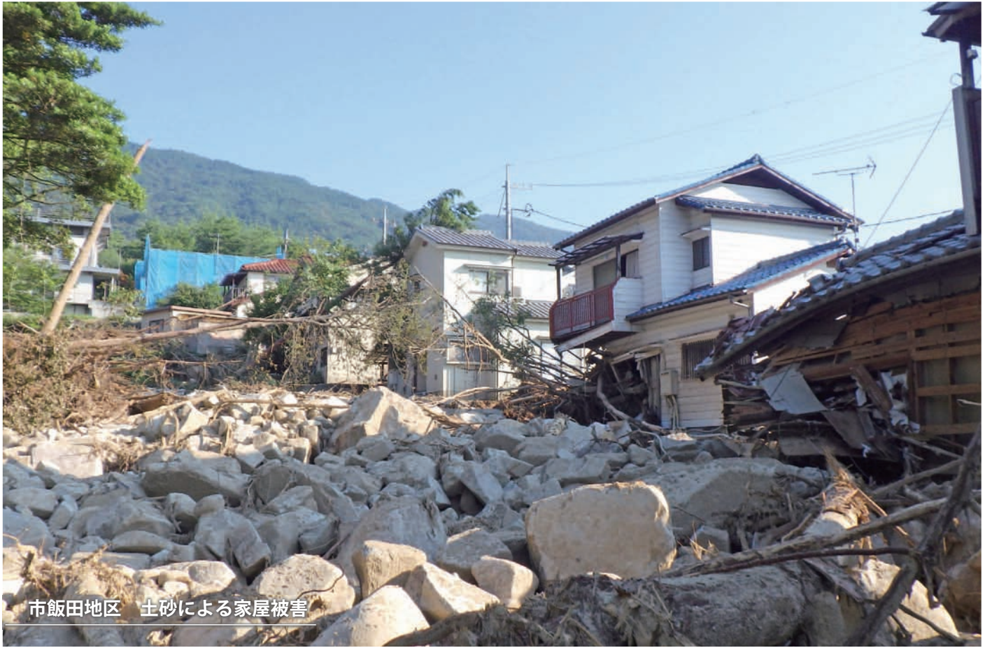
市飯田地区 土砂による家屋被害