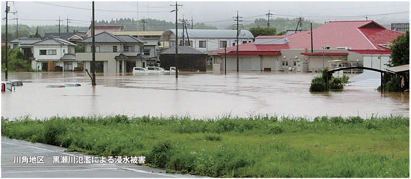
川角地区 黒瀬川氾濫による浸水被害