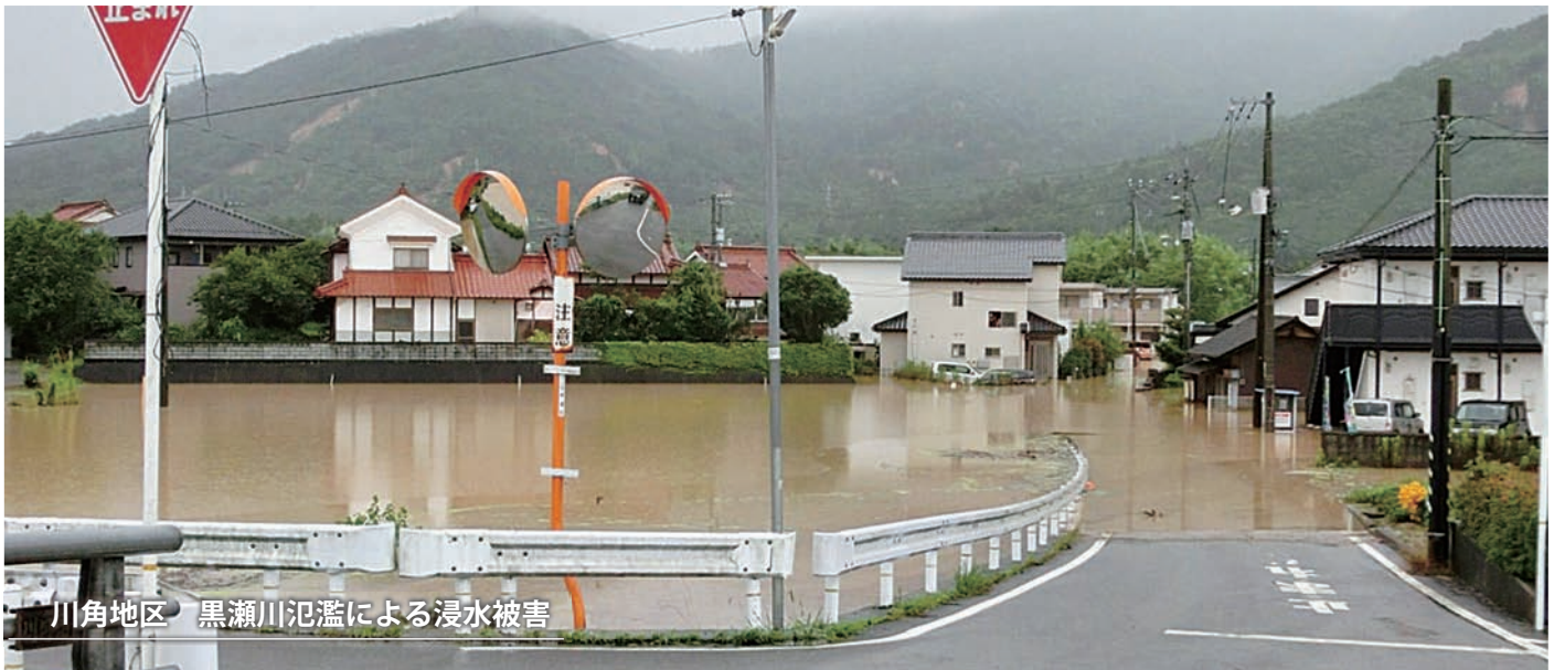
川角地区 黒瀬川氾濫による浸水被害