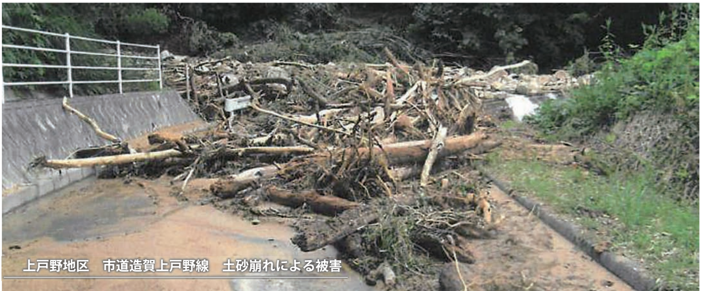
上戸野地区 市道造賀上戸野線 土砂崩れによる被害