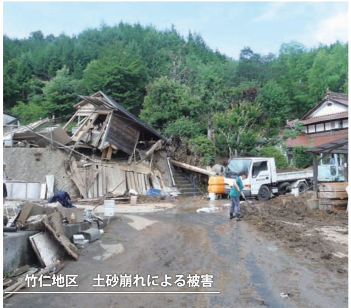
竹仁地区 土砂崩れによる被害