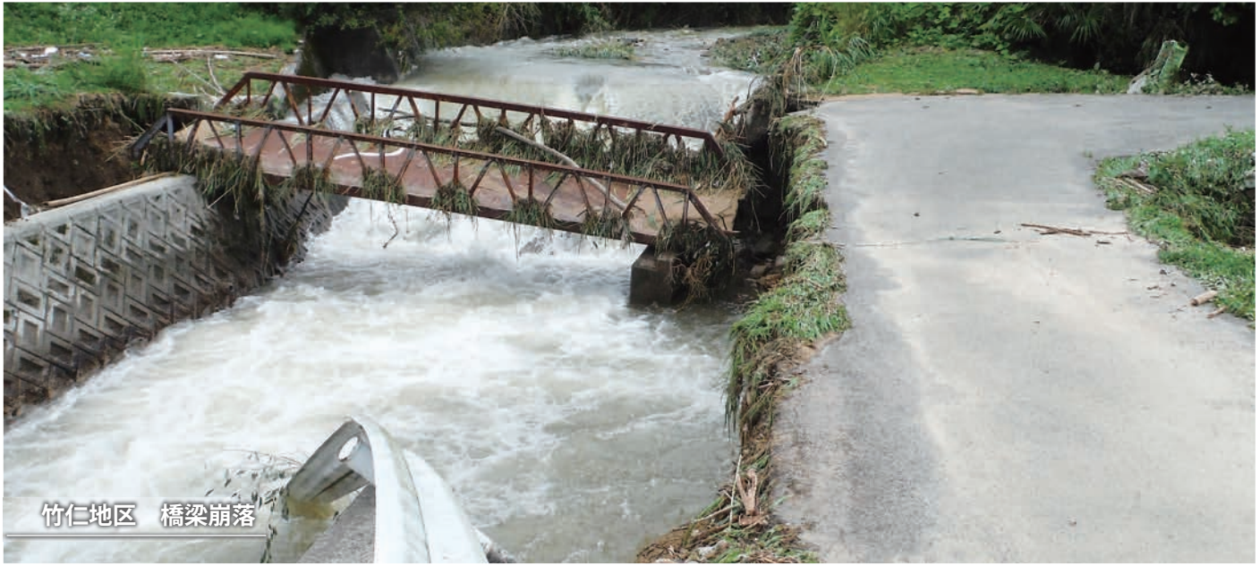
竹仁地区 橋梁崩落