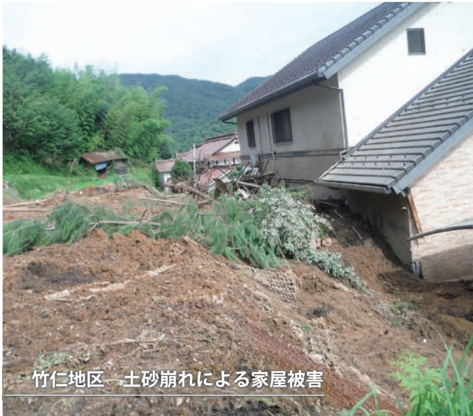
竹仁地区 土砂崩れによる家屋被害