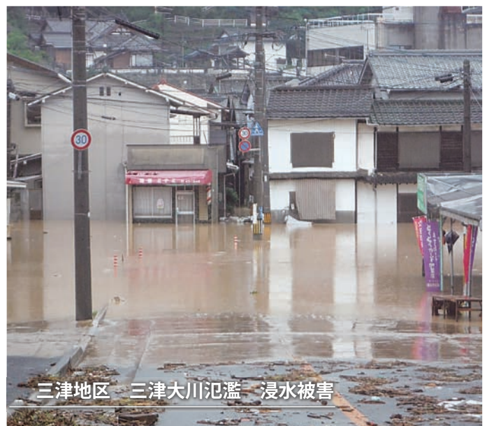
三津地区 三津大川氾濫 浸水被害