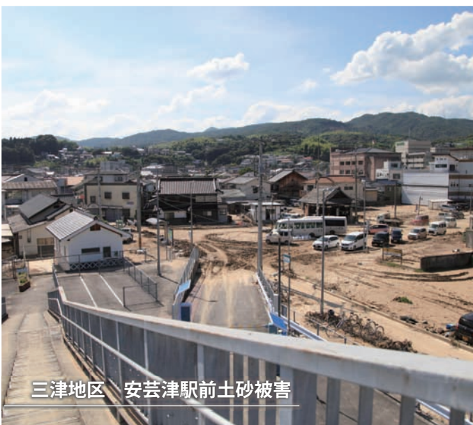
三津地区 安芸津駅前土砂被害