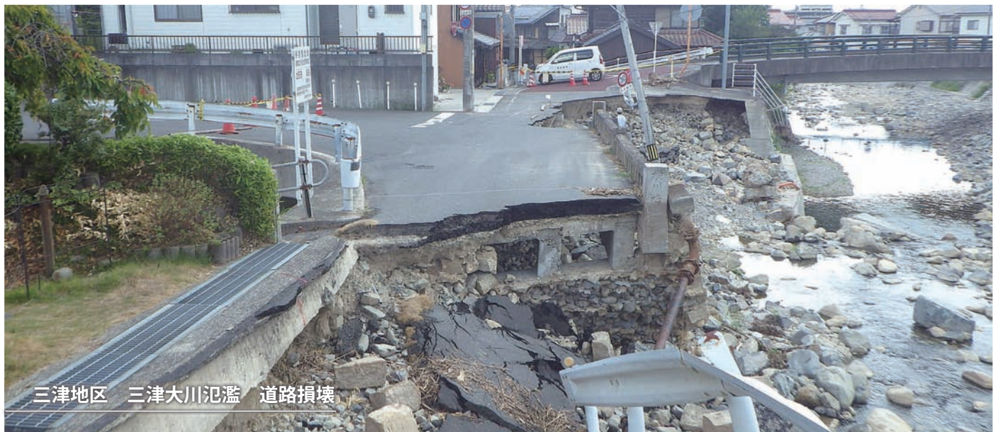
三津地区 三津大川氾濫 道路損壊