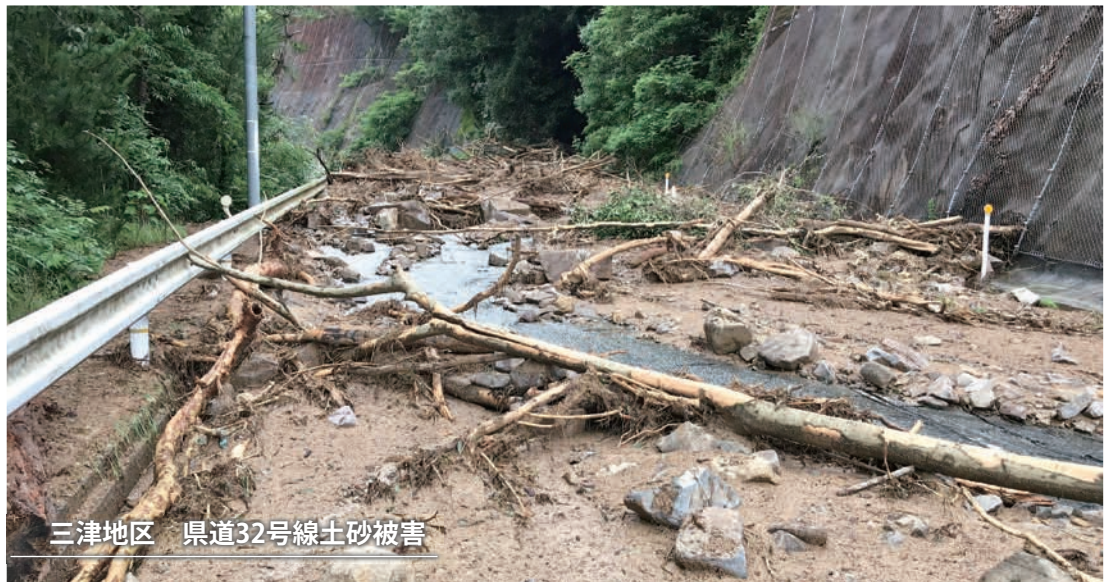
三津地区 県道32号線土砂被害