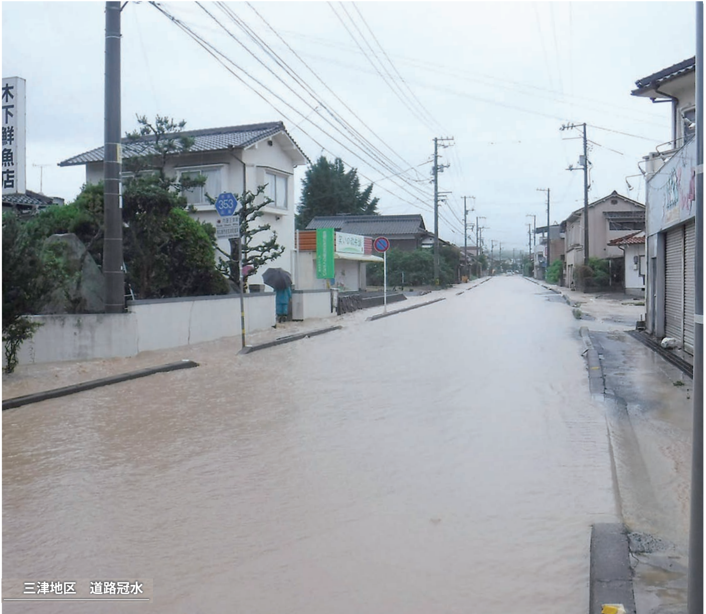
三津地区 道路冠水