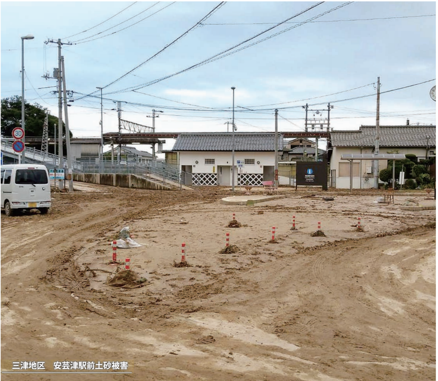
三津地区 安芸津駅前土砂被害