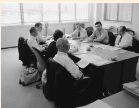
議会会報委員会行政視察（長崎市）

これら視察を行った事項については、本市議会の広報活動においても参考となる点が多く、今後の議会だより、議会ホームページに反映していけるよう努力していきたいと考えている。