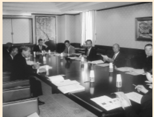
議会運営委員会行政視察（市川市）

愛知県豊田市では、議会の活性化を推進するための特別委員会を設け、質問を1項目ずつ区切り、そのたびに答弁する方式を取り入れるなど、議会自ら改革を押し進めている。