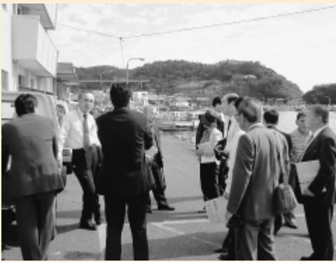
市民経済委員会行政視察（大分市）

●視察地／那覇市・久留米市・大分市 沖縄県那覇市では、地域社会全体で循環型社会を構築していくための「ゼロエミッション基本構想」と、指定ごみ袋を導入しての「家庭ごみ収集の有料化」について、福岡県久留米市では、生産者、消費者それぞれが農業に積極的に関わる取り組みとしての「食料・農業・農村基本条例及び農業振興施策」について、大分県大分市では、全国的な知名度を誇る関あじ・関さばの「ブランド化及びこれを生かした産業振興」についての行政視察を行った。 これら視察を行った事業を参考として、本市の今後の施策に生かしていきたい。