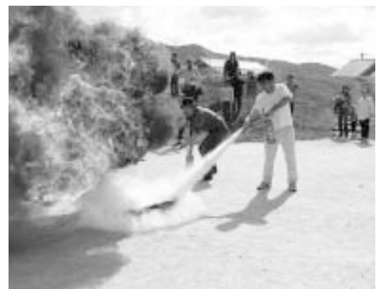
自主防災組織の防災訓練 (あすかパーク)

次に、災害時に出火防止、初期消火、被災者の救護、避難誘導などを行う自主防災組織の役割は非常に重要であると認識している。そのため、未組織の地域に向いて結成促進に努めるとともに、既存組織には訓練指導を行っている。現在6組織だが、