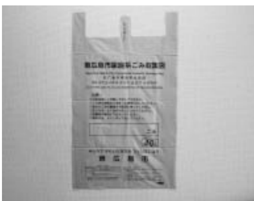
黒瀬町、豊栄町、河内町で使用されている指定ごみ袋

安芸津地域をこの施設の処理対象区域とするためには、竹原広域行政組合構成団体との協議や各構成団体での議決、施設周辺住民の理解が必要なことから、当面難しいと考えている。