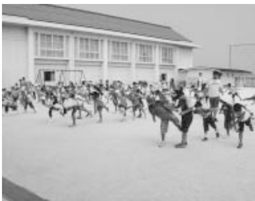
子どもの体力復活プロジェクト（サタデー！外で！遊ぼうDAY！）

また、荒廃農地を運動広場として整備することについて、期限を限った許認可は法的に不可能である。永久的に整備する場合は、農地転用などの手続きが必要となる。こうした手続きや固定資産税の減免措置については、対象となる農地の位置や現況により個別に判断することになる。