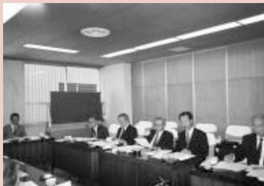
議会運営委員会行政視察

今回、視察した取り組みに関しては、参考となる部分が多く、これからの本市での議会活性化に向けた取り組みや議会運営に反映させていけるよう努力していきたい。