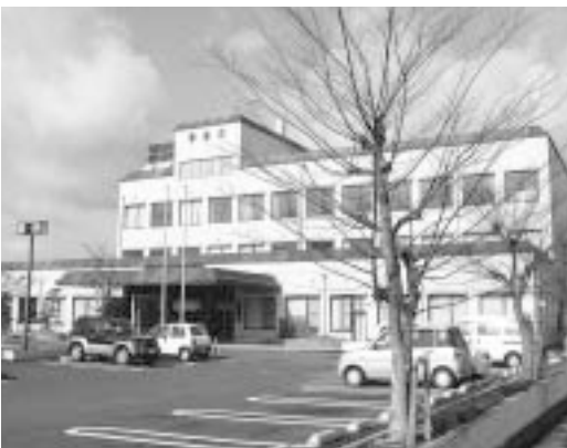
地域包括支援センターが設置される予定の総合福祉センター

⑨平成18年1月以降、サービス量設定の最終決定と保険料設定を行い、第1回市議会定例会で保険料について議案を提出したい。事業計画は3月末までに策定したい。