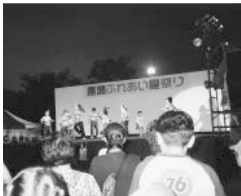
黒瀬ふれあい夏祭り

さらに、企業・NPO団体など多種多様な団体や個人が一体となってまちづくりの活力を高め、住むことに誇りと喜びが持てるような個性あふれた魅力あるまちづくりを進めていく必要がある。