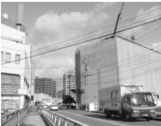
建設中のマンション

また、県移譲事務交付金は、市町の強い要請を受け、県が交付金の算定基準額を明らかにしており、必要額が交付されるものと考えている。