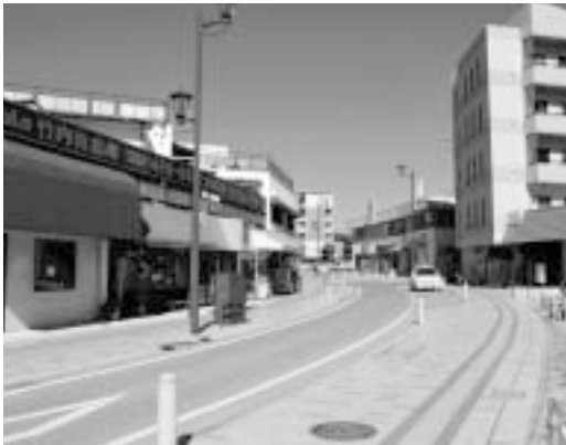
整備が進む中央通り

商業活動活性化を図るTMO構想におけるハード事業では、今年度着工した酒蔵地区の道路の美化が平成22年度、西条駅前土地区画整理事業が今年度末の完成予定である。また、中央通り及び市道一町田吉行線の整備が平成18年度完了予定である。ソフト事業では、酒蔵散策の観光イベントが実施され、酒造会社で