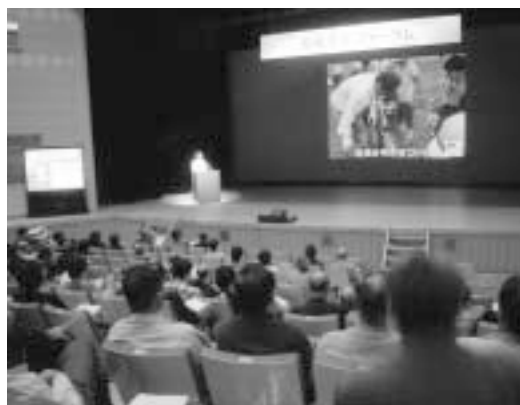
黒瀬川の流域環境フォーラム

提案の用途や調査結果、社会経済情勢等を勘案し、県などと連携を図り、協議・調整を進めていきたい。