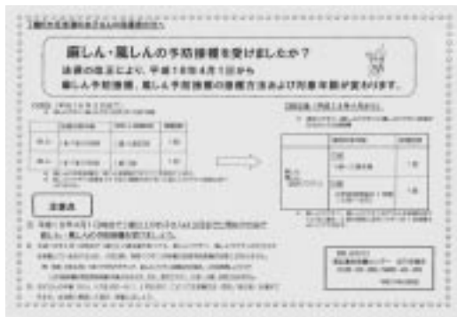
麻しん・風しんの予防接種を啓発するためのパンフレット

子どもの生命を守る観点から、現行の予防接種を平成18年度の1年間継続することを強く要望する。