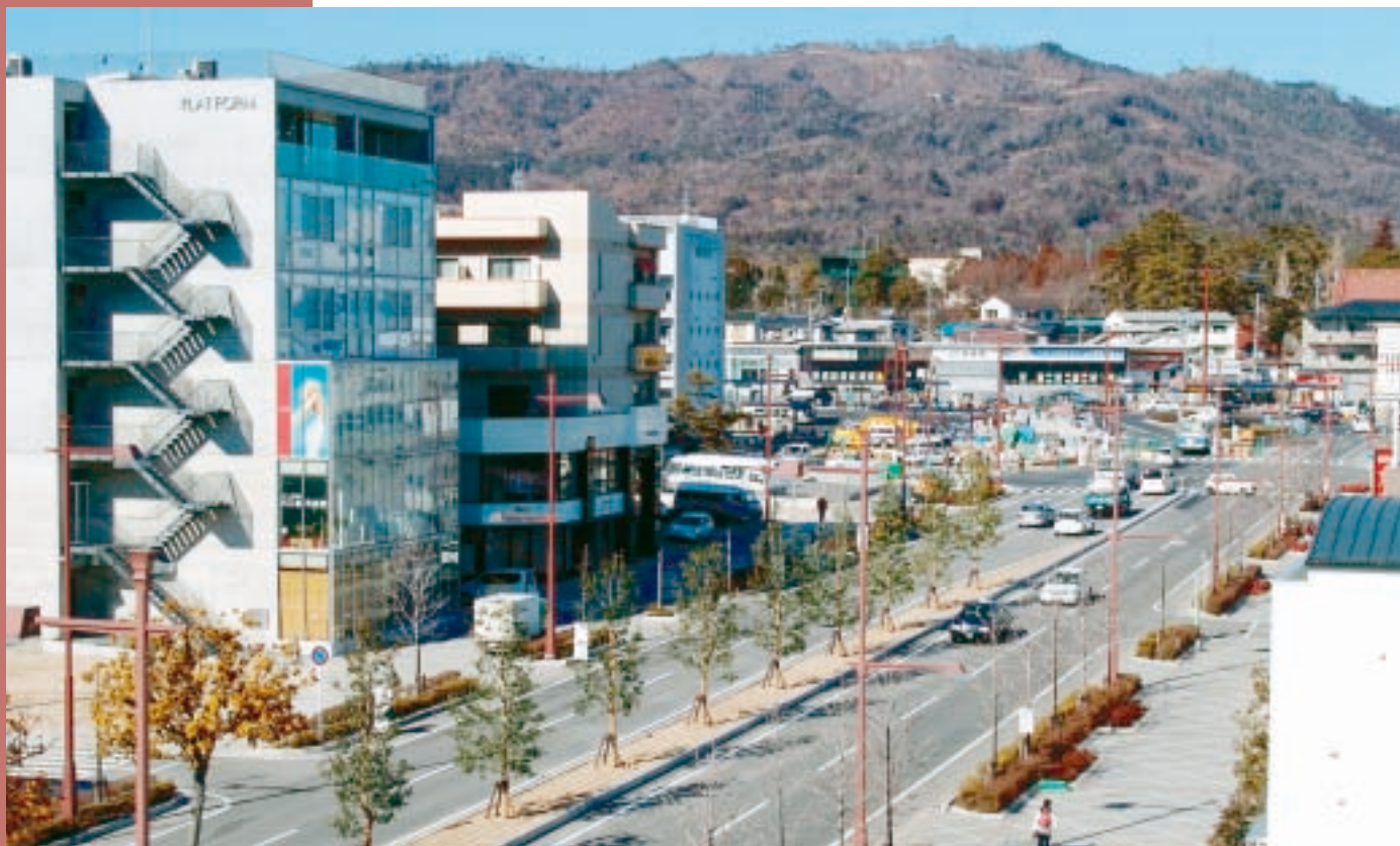
本年度中に完成する西条駅前土地区画整理事業

平成17年第4回定例会は、12月9日から22日までの14日間の会期で開催されました。