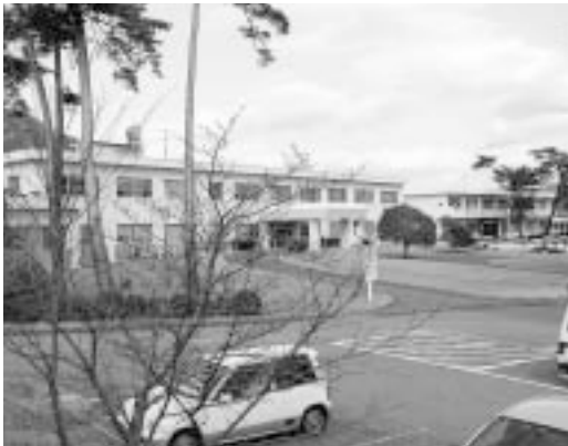
黒瀬町にある賀茂精神医療センター

入院治療専門指定医療機関の整備目標は全国24か所で、1施設30床規模、全体で700床程度である。全国8ブロックの中核的な施設として国や独立行政法人国立病院機構の医療機関を指定し、その他16か所の公立病院に順次整備する計画とされている。中・四国ブロックで独立行政法人国立病院機構賀茂精神医療センターが指定された理由は、精神科専門の医療機関であり、これまでの診