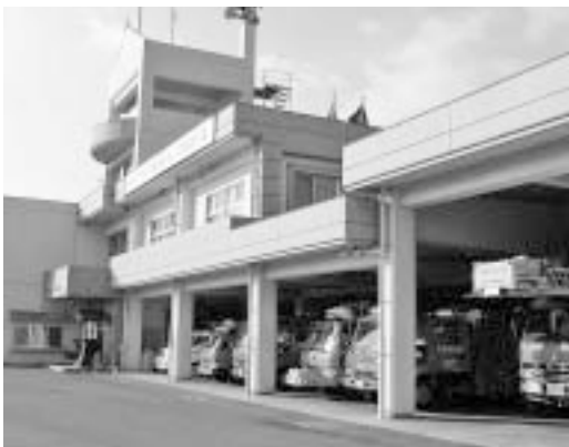
竹原広域行政組合

次に、安芸津町で災害が発生した場合、指揮権は竹原広域にあり、東広島市消防局及び消防団との連携が複雑となる。本市としては、できるだけ早い時期に常備・非常備消防の一体化を図る必要があると考えている。竹原広域に与える影響も考慮に入れながら慎重に検討し、調整を進めていきたい。