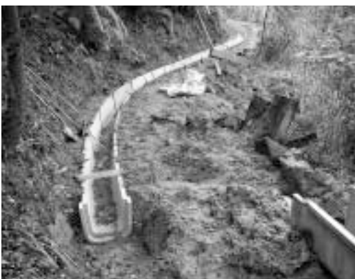
今年度から改良事業が再開された桐迫農業用水路

17年度は、県の補助事業として320mの改良工事に着手した。未着手区間の約250mも、来年度以降、引き続き県の補助を受けながら、早期完了に向け努力していきたい。