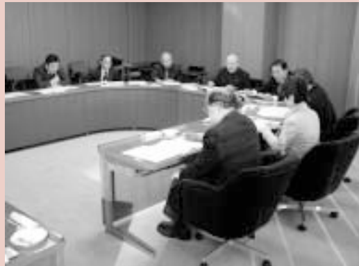
議会会報委員会行政視察

愛知県日進市、静岡県島田市において議会だより及び議会ホームページについての行政視察を行った。