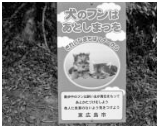
犬のふん放置防止看板

だが、ペットボトルの回収はいつからか。また、回収方法についての市民への周知はどのように行うのか。