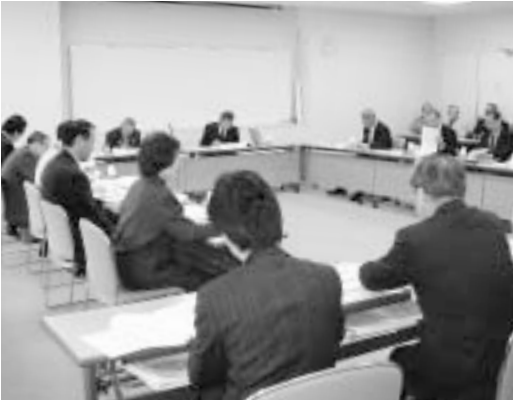
河内地区地域審議会

本年8月、各地区で第1回目の地域審議会を開催し、地域審議会制度の概要と役割、新市建設計画の概要