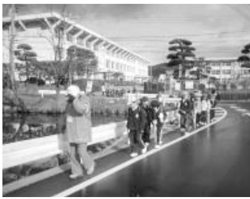
児童の集団下校に付き添う地域ボランティア（川上小学校区）

る活動を積極的に実施されている。活動に対する財政的支援としては、立ち上げ時に、腕章と車両用マグネット式ステッカーを配付した。活動が活発化する中、独自に帽子や腕章を作成された小学校区が8割近くある。作成経費はPTA負担あるいは地域の団体、有志の支援がほとんどである。活動が市民の善意に支えられ、同時に明るい地域づくりにも寄与するものと期待している。