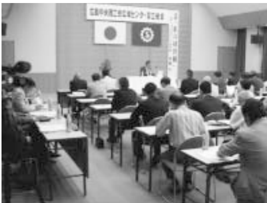
広島中央商工会広域センター設立総会

補助金関係についても、交付による地域活性化の効果を認識した上で、内容の見直しや再検討を行い、効果的・効率的な事務事業の推進を図りたいと考えている。各種補助金の適正性、効果等を精査し、予算編成方針に基づいて予算措置を講じていく。なお、すべての補助金を一律に10%削減する考えではなく、団体補助などは、活動内容や対象経費などの精査が必要と考えている。