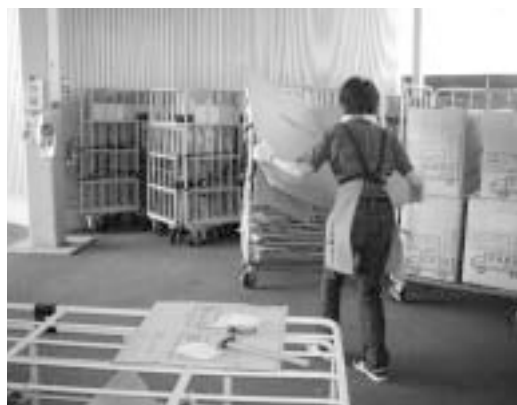
企業に就職し、いきいきと働く障がい者

各企業の雇用率達成状況は一般には公表されておらず、市からの働きかけには限界があるが、関係機関と