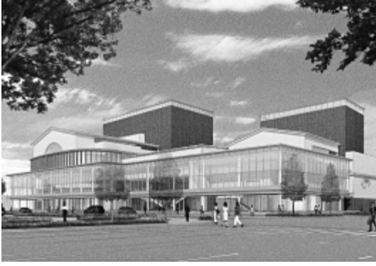
市民ホールイメージ図

で生産していた原材料は、エルピーダメモリの製品製造過程で必要だが、生産が停止したとき、本市財政に与える影響について問う。