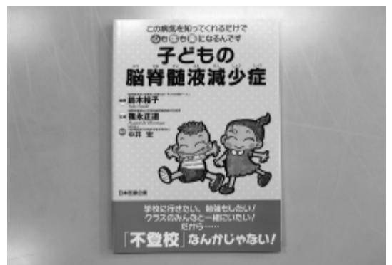
子どもの脳脊髄液減少症の冊子

脳脊髄液減少症は、だれでも遭遇する日常的な出来事によって引き起こされる身近な病気、その患者の多くは、