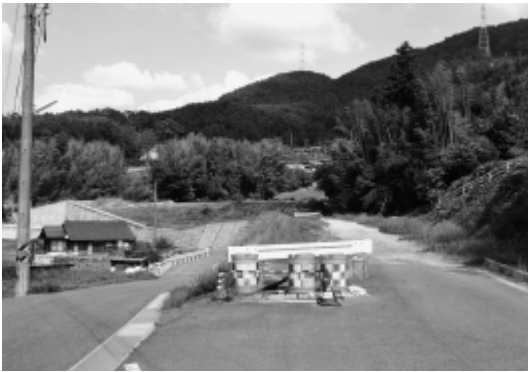
主要地方道東広島向原線

主要地方道東広島向原線は、住民にとって、東広島中心部への移動手段として、利用する住民も多く、道路拡幅による住民の利便性、通行の安全性は格段に改善する。現在の進捗状況と今後の事業の見通しについて問う。