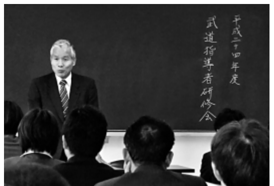
武道の実技指導研修会

けた、安全を講じる措置について具体策を問う。また、保護者への理解をどのように求めているのかを問う。