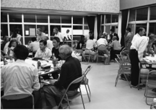
まちづくりワークショップ

住民自治協議会の設立は、予定どおりに進んでいるのか危惧している。各住民自治協議会が機能するために、諸団体との事業・役割分担などを調整し、支援すべきではないか。また、生涯学習機能とまちづくり運営機能を持たせた