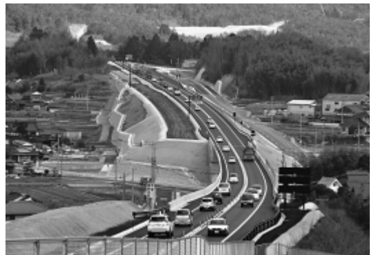
東広島・呉自動車道

東広島・呉自動車道(以下東呉道)の阿賀インターチェンジ(以下IC)から黒瀬IC間が部分開通した。しかし、阿賀ICから高屋ジャンクション(JC)を経由して、下りは奥屋パーキング、上りは小谷サービスエリアまで、時間にして約40分の区間にトイレ休憩所がない。黒瀬ICから馬木ICまでの現在工事中の未開通区間にトイレ休憩所の新設を強く要望するが、所見を問う。 また、トイレ休憩所に産地直売所を併設すれば、1日当たり1万台を超えると思込まれる通行量の1%、1000台から1500台がトイレ休憩所を利用した際に、産地直売所への立ち寄りも期待できる。