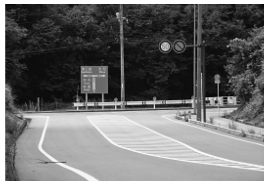
国道375号福富バイパス

一般国道375号福富バイパスの延伸について、国及び県に対し、要望を行っている。しかし、平成6年度に東広島