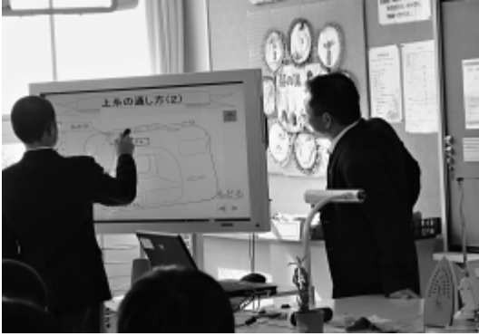
電子黒板を使った授業風景

ICT関連計画に、地域センターのホームページの充実があるが、地域によって格差がある。格差解消に向けての取り組みを問う。次に、e-JOHOシステム廃止の背景を問う。また、今日どこでもインターネットにつながる環