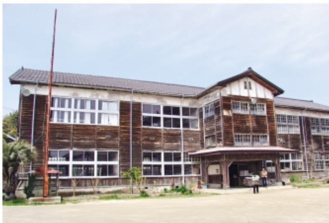
廃校になった大芝小学校