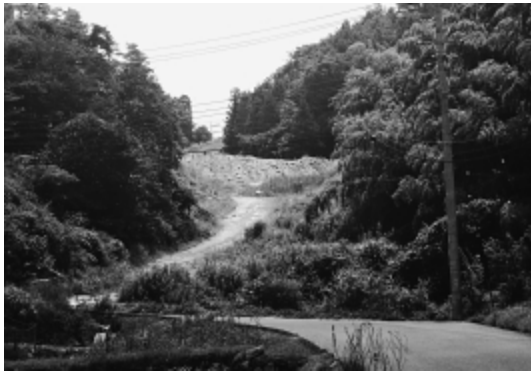
志和町の残土処分場