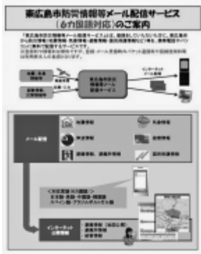
防災情報等メール配信サービス

慮し導入を判断する。災害時要援護者管理システムは、個別計画の作成をしており、今後本市の状況に適合したシステムの導入を検討していく。事業継続計画は、災害時の行政機能の継続と早期復旧を実現する指針として必要性が高く、大規模災害時の計画を策定していく。