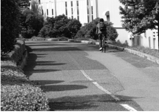
白線の消えかけた普通自転車通行指定部分