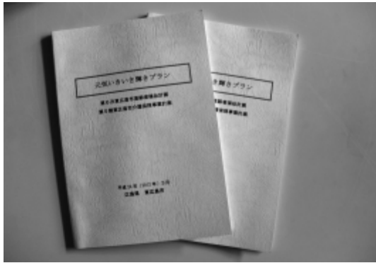
第5期介護保険事業計画

自立支援策は、就労支援として、ケースワーカーによる支援、就労支援相談員の就労意欲の喚起や就労支援プログラムに取り組んでいる。