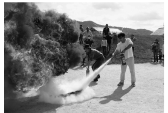
防災訓練をする自主防災組織

最近の国内での大きな災害を教訓に、これまでの計画を見直すことが大事である。東日本大震災において、ある町