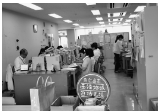
西条地域包括支援センター

人の健全な成長には、人と人とのつながりがなくてはならない価値観であり、先人が培ってきた伝統を後世に伝えることは私たちの使命である。また、市民と行政が対等な立場で長所・短所を生かし、互いに補完、協力しながら課題の解決や社会的目的を達成する協働型社会の実現を目指す必要がある。真の地方自治の確立のため、自ら考え、成長し、行動し、社会環境の変化に対応できる職員の育成、資質の向上が必要である。職員や市役所が変わることにより、市民や地域団体と連携を深め、一体となって、独自