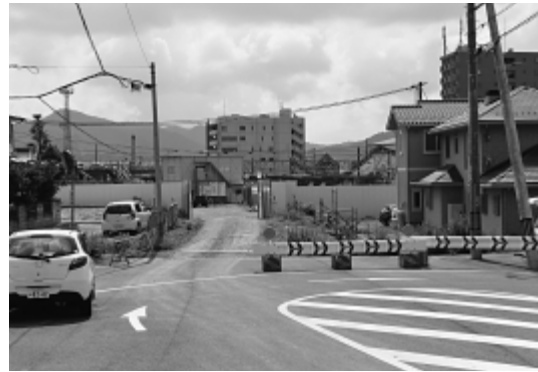
西条駅北側の現状

耐震化や老朽化への対応が課題となっている中央生涯学習センター西棟を残し、2つの施設を将来にわたり管理することは、コスト面において