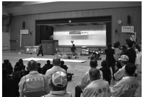
中学校の交通安全教室

えつけないければならない。児童・生徒の交通ルールの遵守と安全意識の向上に向けた、本市の取り組みを問う。