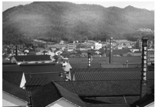
西条駅周辺の煙突のある風景

物は酒造会社の所有物だが、保存の必要性もあると考える。歴史的建造物が点在する地域の景観保全は、所有者等の承諾と将来にわたる維持継承の意思と費用負担に加え、市民、団体、事業者、行政がそれぞれの役割分担を認め合い、景観形成のまちづくり活動が欠かせないと考える。歴史的建造物を保全する行政の支援制度は、街なみ環境整備事業、国の登録文化財制度や伝統的建造物群保存地区制度の活用等がある。現在、国の支援制度や他団体の先進事例などを調査・研究し、市にあった景観保全と活用の方角性を中心市街地活性化計画の中で