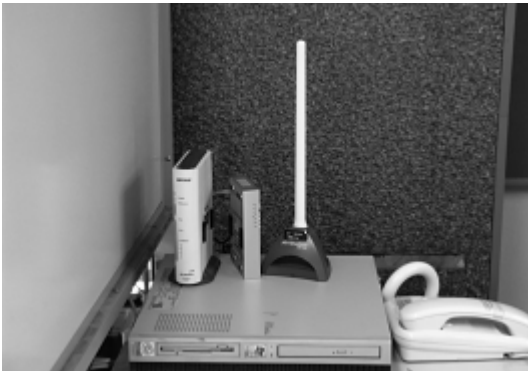
市役所に設置された公共無線LAN

ハード面は、情報通信基盤整備事業の実施により、格差は解消できた。ソフト面として、基本的な操作やインターネットの活用方法など、ニ