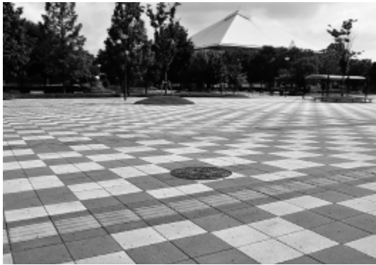
運動公園のマンホール

災害時の飲料水確保のため建設予定の市民ホールの地下に耐震性貯水槽を設置してはどうか。また、駐輪場の地下に下水の排水管を設けてマンホールを連続で設置し災害時に仮設のマンホールトイレにする事例がある。女性や子ども