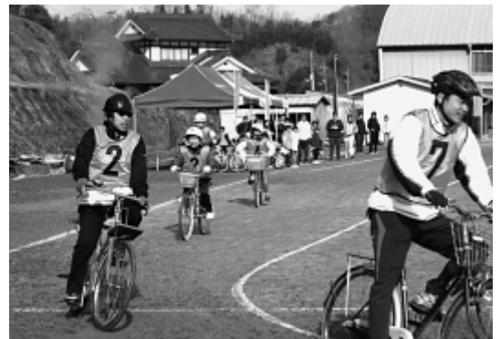
わくわくスポーツランドこうち(ママチャリ3時間耐久レース)

この構想の策定においては、地域や産業との横断的な連携や産業の自立的な発展ができるかどうかを厳しく問われており、国の採択を受ける高い条件になっている。具体策として、里山に眠っている資源を活用した、第一次産業の高度化・高付加価値化、再生可能エネルギーの活用などが民間から提案されると考えている。地域企業や大学と十分協議を進めた上で、取り組み可能な事業を絞り込み、また、市民の意見を反映させるためのシンポジウム等を開催し、構想をまとめたい。将来的に可能性がある新エネルギーとして、太陽光、太陽熱利用、バイオマスエネルギー、温度差熱利用、中・小水力発電の5つを中心にしたプロジェクトをまとめている。研究機関と市内企業との共同研究を促進し、一方では、環境分野の企業誘致にも取り組み、産学官の連携を強化し、新たな産業の創出を目指したい。