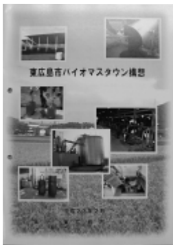
東広島市バイオマスタウン構想

自治体推進協議会から基幹システムの共同利用促進の提案があり、導入に向け協議を始めたばかりである。運用に向け、課題は多いが、本市の情報システムは、自治体クラウドへの移行も考慮しており、今後システム更新時や法制度改正、技術革新への対応時には、導入について検討していきたい。