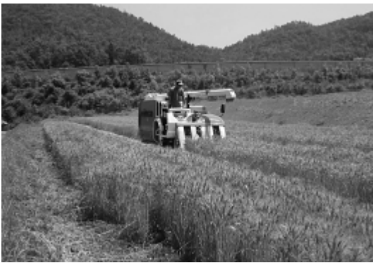
小麦を収穫する市内の集落農業法人

後継者不足や高齢化の進展が深刻な状況であると認識している。本市では、小規模零細な稲作中心の個別経営体からの転換を図るため、集落法人の育成を中心に施策を展開している。今後の支援としては、地域プロジェクト計画に基づき、経営の高度化に係る支援を行うとともに、集落法人の新たな設立に向け、課題の整理、地域の話し合いの場づくりとして、担い手支援員の新設、集落座談会の開催を計画し、農業振興を行う。また、現在4社が農業参入しており、受け入れ農地の確保が課題である。