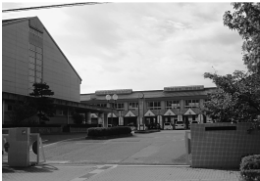
小中一貫・接続教育に取り組む高美が丘小学校

現在の景気情勢からは、今後の市税収入の回復は期待できないうえ、社会保障関係費の増加など、財政基盤の弱体化が懸念される。このような状況下にあつて、さらなる発展に向け、都市の魅力と活力の向上につながる施策に積極的に取り組むと同時に、市民生活の安全・安心の向上に向け、防災対策を強化するなど、全般を通じて、暮らしの安心を実現できる予算となるよう努力をした編成である。