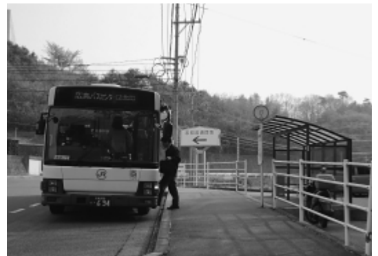
利用者の多いバス停（志和流通団地前）

②住民自治協議会は、地域・行政・さまざまな団体が協働を進める上で、地域を代表する組織として位置づけ、地域住民相互の連帯と自治意識の高揚、地域内住民や各種団体の参画やネットワーク化により、今後、地域の課題等に総合的かつ柔軟に対応する組織と定義をしている。 予算は、地域づくり交付金制度を試験的に導入し、一定のルールで、地域の実情に応じ活用している。新年度から、充実・拡充できるように、可能な地域は、敬老事業実施助