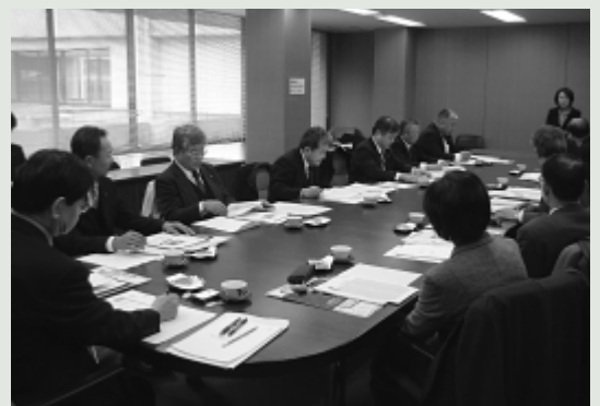
議会改革・活性化特別委員会 行政視察（伊賀市）