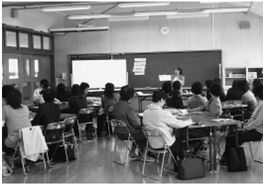
「親プロ」開催の様子

このプログラムは、学習者である親同士の対話を大切にし、子育てについて「学びたい・支えたい」と思う者が互いに語り合う場を提供するこ