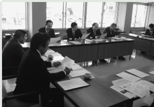
議会運営委員会 行政視察（総社市）

徳島県鳴門市において「予算決算常任委員会・予算説明会」について、岡山県総社市において「一問一答方式」について、三重県鈴鹿市において「代表質問・一般質問」について、視察を行った。常任委員会での予算審査や通告制の導入などは、審査の質の向上に繋がる。質問方式により傍聴者の分かり易さが異なることが参考になった。