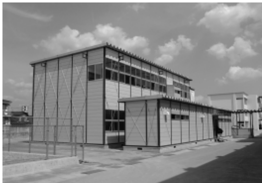
寺西小学校のプレハブ校舎

市民ホール建設を凍結すると、中央生涯学習センターの耐震性や老朽化対応に多額の経費がかかる。計画に沿って合併特例債を活用し市民ホールを建設することが適切だと考えている。寺西小学校の児童数増加については、校舎の増築、学校の分離新設、学区の見直しなども含めて検討しており、市民ホール建設にかかわらず、できるだけ早期に具体的な対策につなげたい。