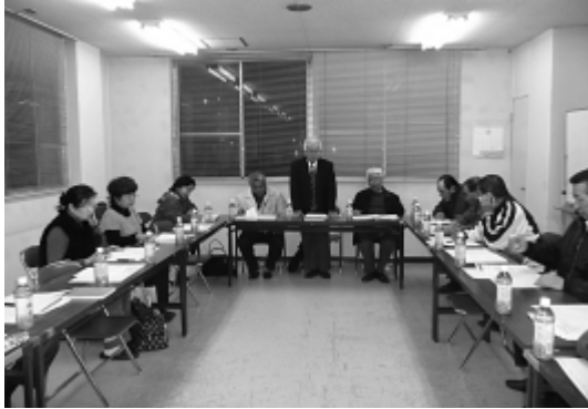
御園宇小学校区住民自治協議会設立準備会役員会