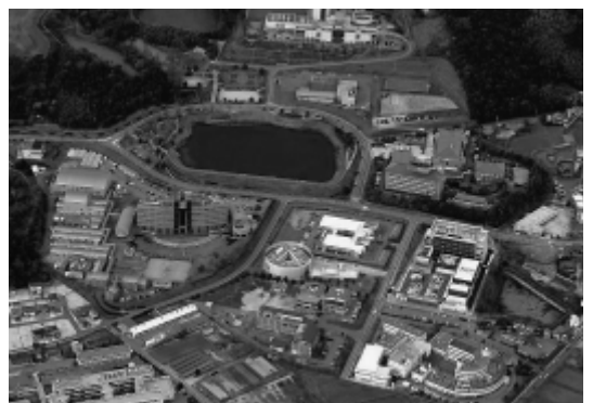
サイエンスパーク 航空写真

関が集積しており、新たな事業が芽吹く環境が揃っている。新産業育成として、民間活力の発掘・支援について、技術面・経済面の具体的支援はどのようなものがあるか。