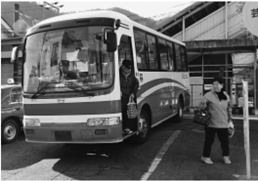
河内 あゆピチふれあい号

黒瀬地域及び旧市の区域は、既存の公共交通との連携及び利用促進を図りやすい環境であるため、市としては、地域公共交通の導入・検討を主導することや直接運行は行わず、地域の自主性を生かし、地域の実情に合わせた地域主体の地域公共交通の導入を目指し、支援制度を構築したい。