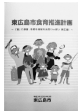
東広島市食育基本計画