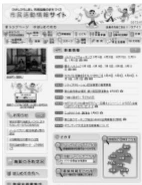
市民活動情報サイト

市民活動情報サイトによる情報提供・研修会・講演会などを通じ、地域プラットフォームの意義や協議会の持つ特性などを、ともに学習する場を設定するだけにとどまっているが、協議会の設立まで、また、設立後も、協議会と各団体とが意見交換を行