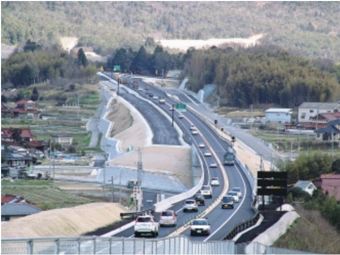
開通した東広島・呉自動車道 (黒瀬 IC ~ 阿賀 IC 間)

黒瀬 IC から阿賀 IC 間が 4 月 1 日(日)に開通しました。整備後は山陽自動車道から呉市役所までの所要時間が約40分となりました。