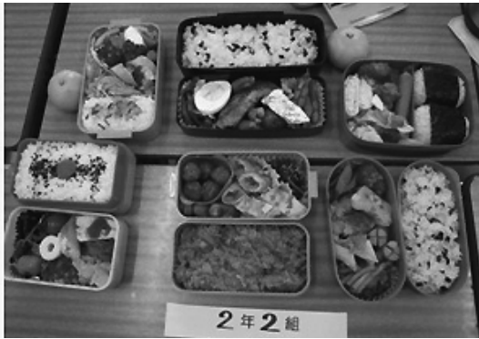
「作って！食べよう！弁当DAY!」で作られたお弁当

市内全小学6年生、中学3年生を対象に、自分がつくった弁当を学校で一緒に食べるもので、食の大切さ、家族や生産者等への感謝の気持ちを持つことにつながると考えて