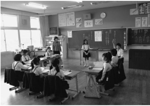
小学校の授業風景

②福祉バス事業については、 すべて地域公共交通に切 りかえ運行していることや、 高齢者タクシー割引乗車券交 付事業を整備していることか ら、導入を具体化する状況に はないと考えている。