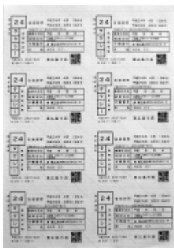
市内全域に拡大したタクシー割引乗車券

新年度予算において拡充するサービスは、まず在宅高齢者の安否確認を行う緊急通報システムの改善、次に生きがいづくり対策としてシルバー人材センターの運営補助の拡充、最後に外出支援として、タクシー割引乗車券の交付対象を、市内全域へと拡大した点である。