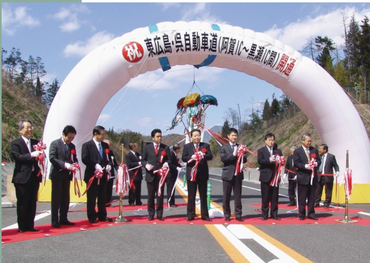
東広島・呉自動車道開通式（黒瀬IC～阿賀IC間）