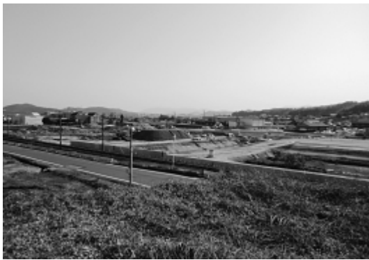
開発が進む寺家地区

総合計画の人口推計は過去の人口動向を参考に統計的に算出したもので、ある程度の幅を持つ推計値の中間的な数値である。成長戦略は成長が最も見込まれるパターンを想定しており、本市の潜在的な成長力を引き出すことで、目標値を達成する可能性はあるが、厳しいハードルではあると考えている。「日本一住みよいまち」とは、政治目標を簡潔明瞭に示したビジョンであり、総合的な住みよさを追及することで、目標実現につ