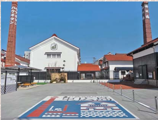
西条本町 歴史広場

西条酒蔵通りに面しており、観光案内板や休憩スペースとして屋根つきのベンチも設置されています。