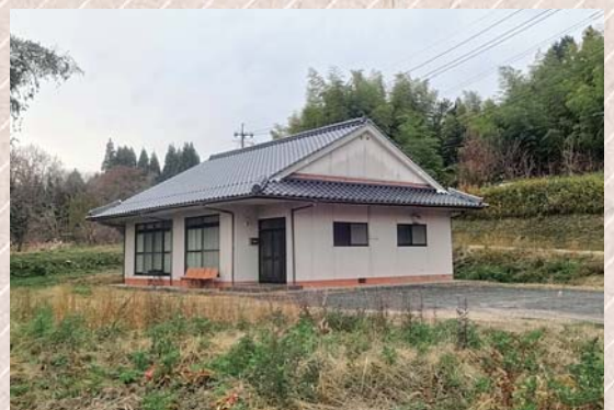
助谷上コミュニティ集会所