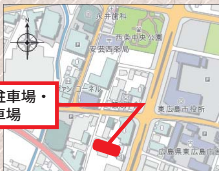
西条昭和町自転車駐車場・駐車場位置図 (地図：ひがしひろしまつづ)