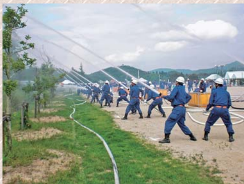
消防団の訓練の様子