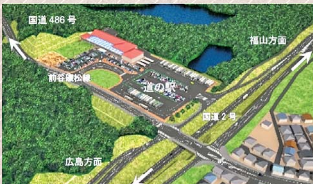
(仮称)道の駅西条のイメージ図