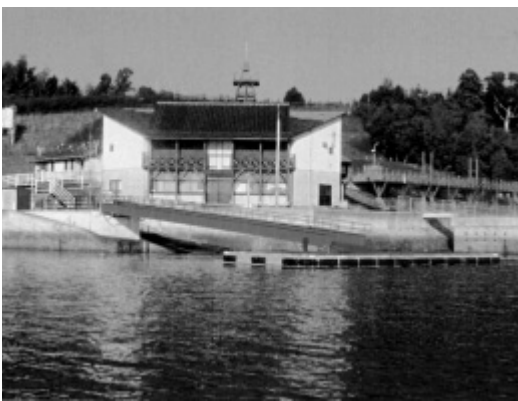
コンクリート製に改良された龍王島の浮き桟橋

内陸地域と海洋地域を結ぶ連携軸については、現在、交流基盤整備事業として国道185号バイパスや上条浜田線を整備中で、これにより、安芸津地域における東西軸と南北軸の連携軸が加わり、新たな交流が生まれるものと期待している。このほか、安芸津地域の農水産物のブランド化や、休校中の大芝小学校を活用した朝市、観光イベント、商工会や漁協などが行う取り組みに積極的に