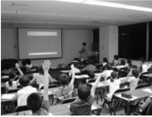
ひがしひろしまスペースクラブ

広島大学との連携では、子どもたちが宇宙などの科学的興味・関心を追及する「ひがしひろしまスペースクラブ」、地域社会の学習ニーズに即した講座を開設する「市民参画型生涯学習企画講座」などを実施している。近畿大学工学部では、本市の歴史や文化、教育、福祉、産業を学ぶ