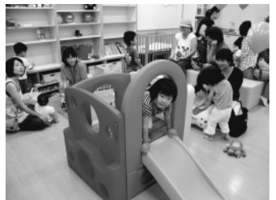
7月に開設された子育て・障害総合支援センター（プランコ）

①子育て相談については、現在多様な相談支援窓口を設置しているが、交流の場の設置や相談窓口の一元化、相談支援機関相互の連携強化が課題である。障害者支援の分野では、3法人に委託し、相談支援事業を実施しているが、今後、利用しや