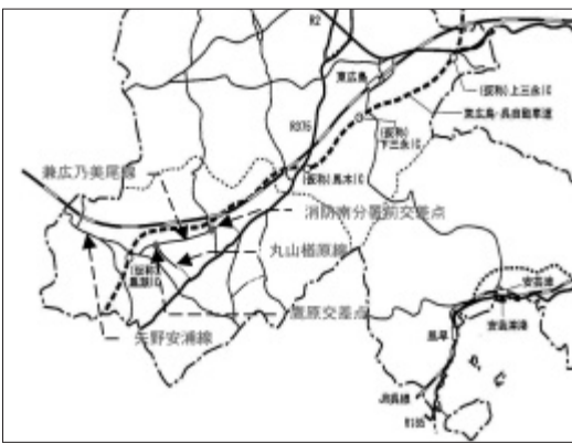
黒瀬町付近の道路網

ひまわり団地については、建物所有者全員から公共下水道への切り替えの同意を得ているが、排水設備確