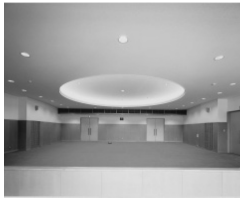
生涯学習施設に改修される福富支所の旧議場

活用方法が未定の部屋が残っているが、これらについても市民に喜ばれるような有効利用を進めたい。