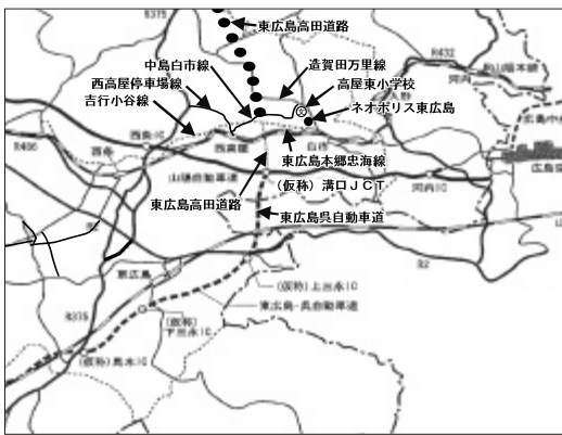
白市・西高屋地区の道路網

県道造賀田万里線も通学路として危険な状況にある。白市2工区の早期改良を県に要望し、ネオポリス団地側から高屋東小学校までの工事を先に進めてほしいがどうか。また、朝夕の交通量が多く危険な状況にあ