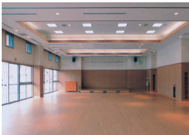
黒瀬保健福祉センター 多目的室

鉄筋コンクリート1階建ての建物には、多目的室や調理室、試食室、相談室、会議室、ベビーコーナーなどがあり、黒瀬町の保健福祉活動の拠点として期待されています。