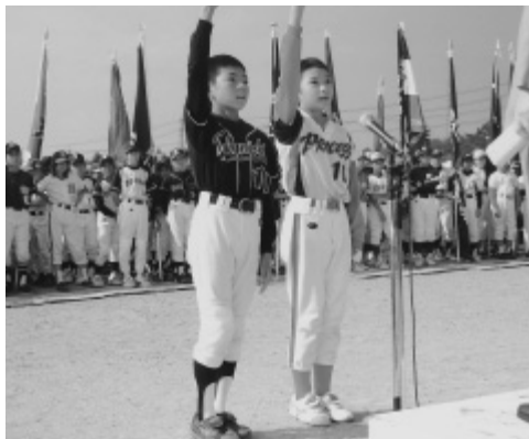
本市で開催されている西日本少年ソフトボール選手権大会

本市にはソフトボールなどが可能な施設が10か所程度あり、休日には小学校のグラウンドも利用できる。大規模大会開催の際には、予選会場を分散するなどの検討をしていたきたい。市としては、所管施設の使用の調整など、側面的支援をしたい。