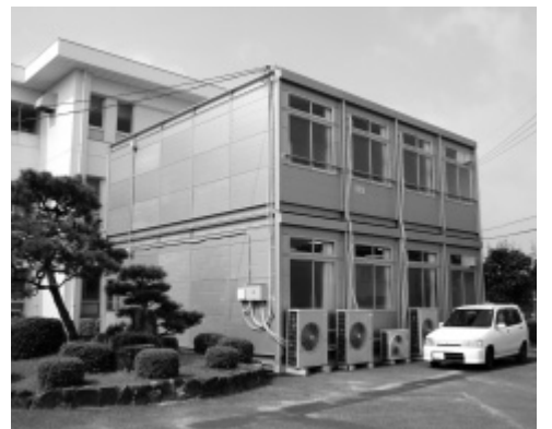
御園宇小学校に設置された仮設教室

そこで、現在1医療機関につき1日500円必要な乳幼児医療費を、以前のように無料化する考えはないか。また、小学校卒業まで医療費を