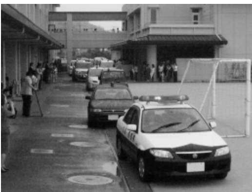
青色回転灯自主防犯パトロール車出発式