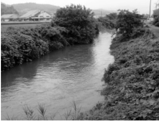
雨で増水した黒瀬川（西条町寺家）

ス道路が必要と思うかどうか。既存の生活道路は非常に狭く危険だが、どのような整備を考えているか。本地区を流れる黒瀬川は河床が高く、河川の水位が上がると雨水排水が機能しなくなるが、雨水排水対策にどのように取り組むのか。