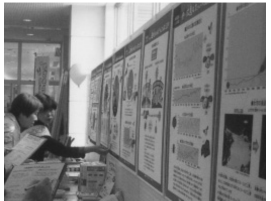
エコINNくろせの活動風景

我が国の出生率がわずかに持ち直したと報道されたが、人口を維持できる水準は2・07と言われており、3人以上の子どもを産み育てる保護者は重要な存在である。その意味において、経済的支援、子育て環境整備支援を充実させることが必要と考える。そこで、①第3子以降の学校給食費の助成、②子育て不安を母親