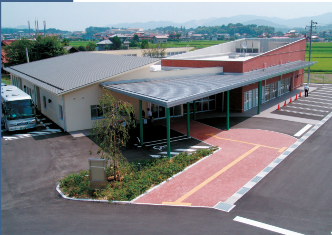
黒瀬保健福祉センター

平成19年第2回定例会は、6月11日から25日までの15日間の会期で開催されました。