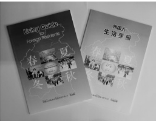
外国語を併記したガイドブック

ユニバーサルデザインは、民間企業や地域への推進も必要である。市民ニーズを把握し、先進自治体の例も参考にしながら、推進の方向性を