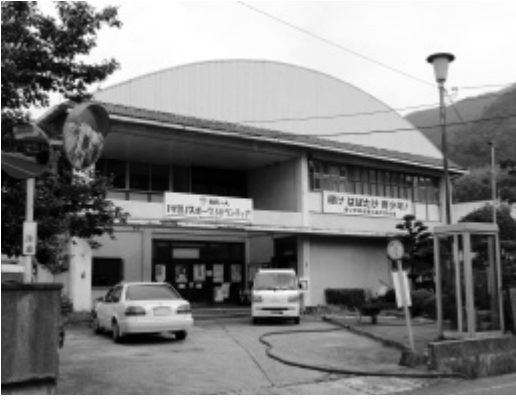
老朽化が進む河内公民館

築後40年を経過し老朽化が著しい現施設の改築については、合併後、財源の確保や課題の検討などに取り組んできた。本年度、河内支所の2・3階の空きスペースを生涯学習施設として利用できるよう改修するため、