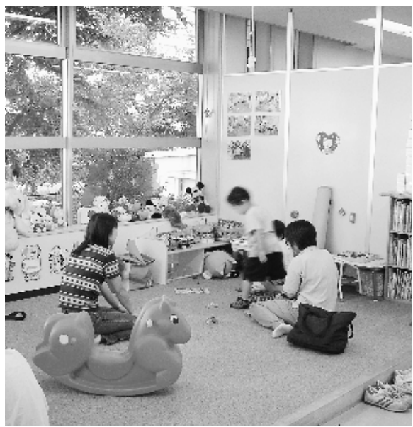
▲ 児童青少年センター

青少年を取り巻く環境は著しく変化し、問題を複雑かつ多様化している。遊び場不足、遊び集団の変化、自然体験・勤労体験の不足、切磋琢磨の機会や異年齢の触れ合い不足、過保護・過干渉あるいは放任・虐待・放置など家庭の教育力低下などが、青少年問題の背景にあると考えている。これらに加え、学ぶことの意味が見出せないという学習意欲の低下や職業あるいは社会に対する「志」の減少、さらには地域における存在感の喪失などもあると考えている。