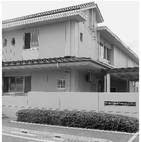
▲ 西条学校給食センター

学校給食センター化については、平成十一年三月の行財政活性化懇話会からの提言を受け、第二次行政改革大綱及び実施計画において、市内を六ブロックに分けてミニセンター化する構想を打ち出している。平成十三年四月に開設した三千食規模の西条学校給食センターでは一定の経済効果を上げている。さらなる経済効果を追求するため、昨年八月、庁内の関係部局による学校給食センター設置検討委員会を立ち上げ、今後の給食センターの規模の拡大、あるいは