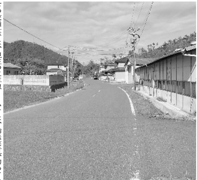
川上弾薬庫北口付近の道路

川上弾薬庫北口付近の道路は、弾薬輸送に伴い生活道として支障を生じることから、主要地方道馬木八本松線から弾薬庫北口間を昭和四十三年度から二車線、道路幅員七メートルで計画し改良したもので、その後、工場や家屋等の建設のため造成され、現在では地形が変化し、路肩が広い部分や余裕地が発生している箇所もある。一日当たり五百台から千五百台の交通量の処理が可能となっており、通