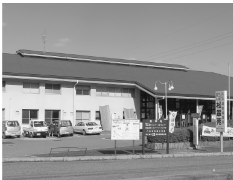
▲ 福祉センター松翠苑

一点目の公民館と移動公民館との違いについては、地区公民館には館長一名、活動推進員兼事務職員を一名配置しているのに対し、移動公民館は公民館のない八本松小学校区と高屋西小