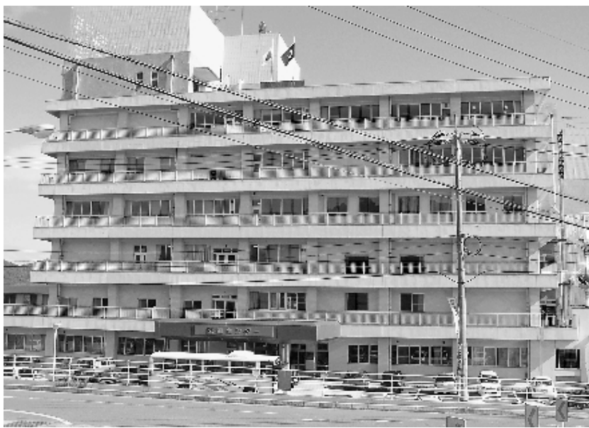
▲ 広島県立リハビリテーションセンター

一命を取りとめた後、社会や家庭に復帰するため、総合的に支援を行う機関への要望は高いものと考えられる。本医療圏においては、広島県立身体障害者リハビリテーションセンターがこうした機能の一部を発揮しているものと認識している。このセンターには総合相談室という組織