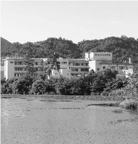
▲ 国立療養所広島病院

本市において総合的な診療科を備えた病院としては、平成十三年十二月に統合を得て二十一年診療科となった国立療養所広島病院がある。統合にあたり、手術、放射線治療等が新設され、緊急手術や今までできなかった治療への対応が可能になり、また、本年六月には一棟棟が新たに開設されるなど着々と体制の充実が進んでいる。また、本市