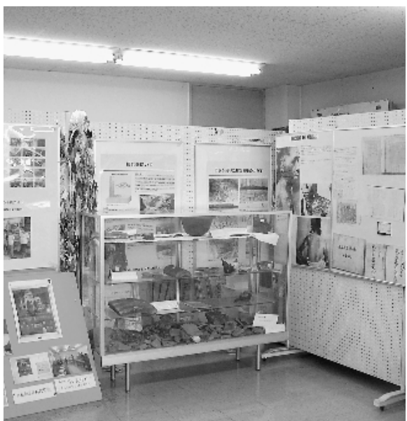
▲ 原爆資料の展示(福祉センター松翠苑内)

点もの資料を展示するには狭い状態である。また、原爆資料保存推進協議会は市の中心部への移設を希望している。県立埋蔵文化財センターとの合築方式で市立博物館、美術館を建設する検討がされているが、この施設内に原爆資料を展示する場所を確保していただきたい。