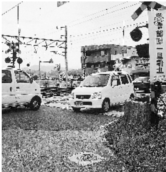
▲ 西高屋駅近くの踏切

なく、踏切を渡らずに南北を横断できる跨線橋により交通網の整備を推進していただきたい。入野川の河川改修では一部用地交渉の遅れがあるようだが、十六年度にはかなり進む予定であると聞いている。東広島県自動車道の開発も踏まえ、西高屋駅の周辺はこれから大きく変貌せざるをえない。平成十六年ごろから市街化の見直しに入ると聞いているので、都市計画の見直しの際には駅南側の開発計画を切に要望する。