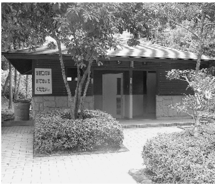
▲ 鏡山公園のトイレ

質問 鏡山公園は国の指定を受けた本市の代表的な観光地であり、また、市民の憩いの場にもなっている。鏡山公園を安全で快適な触れ合いの場となる魅力的な観光地とするために、早急にトイレを水洗化する必要があるが、その整備及び時期について伺いたい。