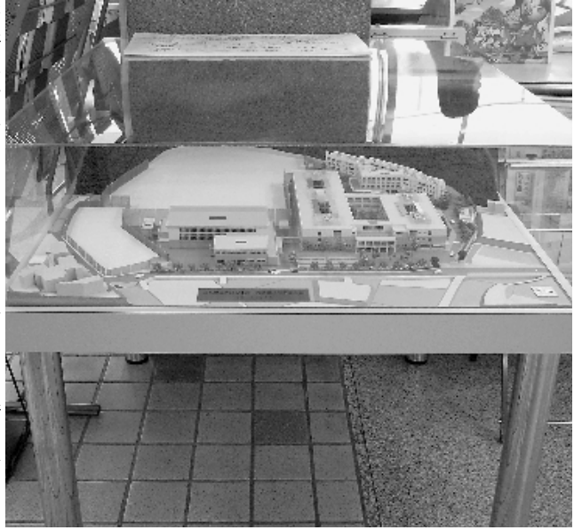
▲ 中高一貫校（広島県立広島中・高等学校）模型

学級が実現されるよう国や県に引き続き要望していく。 地元公立高校への進学率は平成十五年三月卒業生で四〇・二パーセントとなっている。来年四月に開校される中高一貫の広島県立広島中・高等学校の通学区域は全県一円となっているが、寄宿舎の規模等から実質的に市内生徒が多く進学するものと予想され、地元高校への進学率向上という本市の課題にも対応したものであると考えている。しかし、平成十七年度から賀茂高校生活科学科が募集停止となり、また周辺五町との合併が実現すると市内公立高校が四