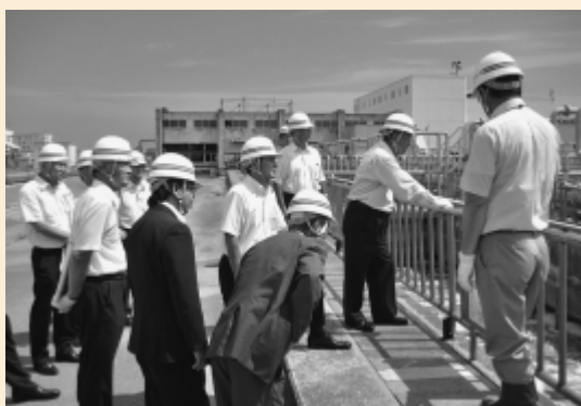
建設委員会 行政視察（仙台市）

盛岡市では盛岡駅西口開発について、仙台市では南蒲生浄化センターの復興について視察を行った。盛岡市は、盛岡駅東西自由通路やバスターミナルなどを整備され、盛岡駅を中心に人などの交流が進む都市開発がされており、本市の参考となった。仙台市では、市民の約7割の下水処理施設が地震と巨大津波により被害を受けられたが、災害に対する取り組みや体制など学ぶことができた。