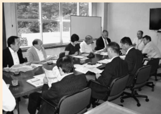
市民経済委員会 行政視察（釜石市）

釜石市ではごみ収集・分別、青森市ではがんばる企業応援事業について視察を行った。釜石市は、昭和54年に全国で初めて直接溶融・資源化システムを導入しており、ごみを分別していなかったが、ごみ処理方式にとらわれない減量に取り組んでおり、市民と協働した地道な活動は、参考になった。青森市は、製品の開発・研究から事業化、販路拡大まで、事業展開に合わせた支援をしており、企業の状況に合わせた支援の重要性を認識できた。