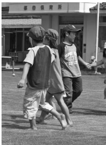
芝生化された保育所の園庭(北広島町)

現在、河内地区の自治組織やNPO法人は、自主費用を捻出して子どもたちの体に優しい校庭に改修させるため、具体的な計画を進めようとしている。管理においても、地域が学校をサポートしようと前向きであるものの、河内小学校の校庭をモデルケースとして行うには、教育委員会の意思