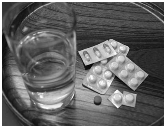
ジェネリック医薬品イメージ

日本の総医療費は年々増加し、大きな課題となっている。また、総医療費の約2割を薬剤費が占めると言われ、厚生労働省では、改善策の一つとして後発医薬品の普及促進に取り組んでいる。後発医薬品は、先発医薬品と同じ有効成分・効能を持つが、先発医薬品よりも値段が安く、患者の自己負担軽減や医療保険財政の効率化につながると言われている。そこで、次のことについて伺う。 ①本市の国民健康保険の総医療費に占める薬剤費の割合と総医療費の今後の推移を伺う。