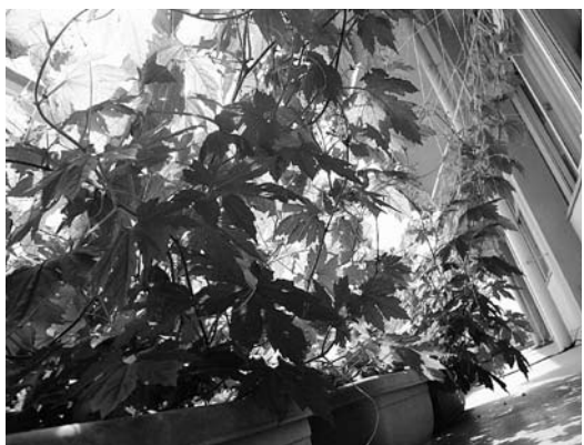
グリーンカーテン

が、市中心部で保育所定員が不足する現状を踏まえると、当面、市中心部で必要なのは保育所であると考えている。老朽化した公立保育所の更新と待機児童の解消を図るため、民設民営の保育所設置を進めており、認定子ども園の機能を含めることは考えていない。