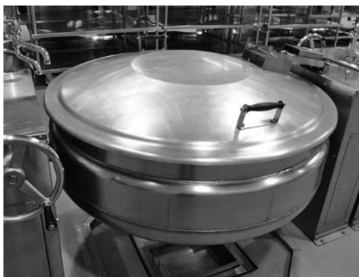
東広島学校給食センター

中学校卒業生が多く通い、昨今の不況で地元高校への入学の思いも高まる中、学校存続に向けて、市は県教育委員会に対しどう働きかけていくのか伺う。また、高校を存続させて、生徒数を増やすために通学補助などの取り組みの考えはないか伺う。