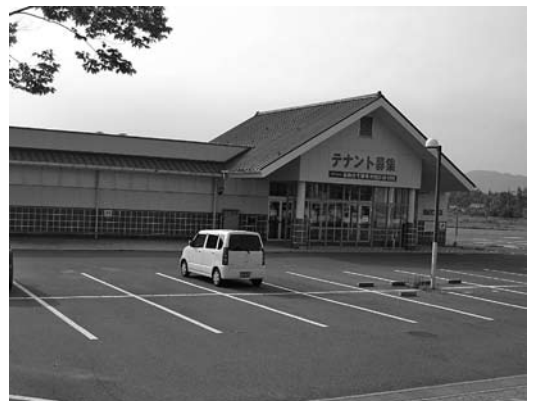
高美が丘タウンセンター

後20年が経過して住民の高齢化も進み、高美が丘小学校の児童数も激減している。ショッピングセンターの撤退により空洞化したまちの中心部の現状は、都市機能が失われた観が否めず、その回復には行政の積極的な関与が必要と考える。そこで、高美が丘タウンセンターの現状認識と、今後の取り組みについて伺う。