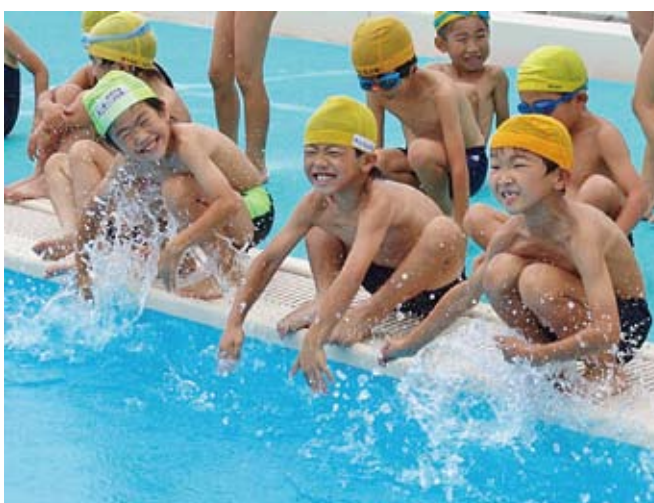
高屋東小学校 プール

子どもたちは、きれいで充実した環境の中で、水泳の授業を受けられるようになりました。