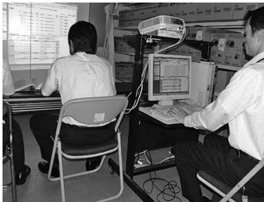
契約課電子入札システム

に当たっては、一般競争入札においても積極的に参入を図っている。その結果、昨年度の建設工事発注における地元企業の受注状況は、指名競争入札では約99%、一般競争入札では約88%であった。