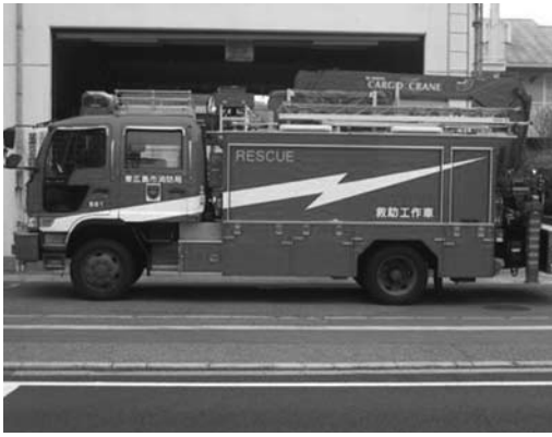
同型の救助工作車