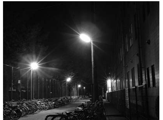
試行中のLED照明（防犯灯）

国において、費用便益比の値が1以下の事業は、事業内容の見直し等の検討を行い、継続の可否を決定する予定である。安芸津バイパスは、車線数を4車線から2車線に変更す