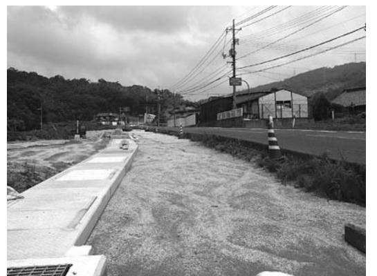
改良工事中の国道375号杵原バイパス

375号バイパスまでを結ぶ道路改良について、平成19年に質問した際には県が用地買収交渉中とのことだったが、先日、地権者が買収に同意したと伺った。については、現状と今後の整備予定について伺う。