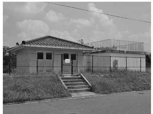
福富簡易水道のタンク

現在、福富簡易水道で供給している地区は、ボーリング井戸を水源とした金口地区のみであり、水道の使用量は近年減少傾向であった。ところが、昨年9月に道の駅湖畔の里福富が開業してからは、土・日・祝日などには、水道の使用量が増大し、ボーリング井戸から取水するポンプはフル運転をしていた。連休などでこのような状態が続くと、ボーリング井戸の水位が低下し、取水量も減