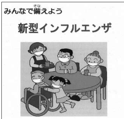
新型インフルエンザ対策リーフレット

現在、本市では、地域の学校安全ボランティアによる児童の登下校の見守り活動などで不審者の出没件数が減少していることや、次年度以降の運用コスト等から、ICTタグ導入は、現時点では困難と考えている。