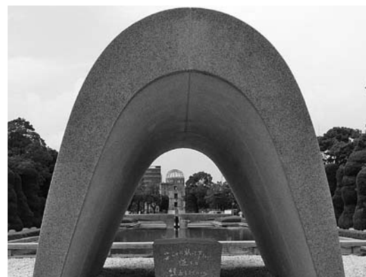
広島平和記念公園

麻生総理大臣も期待感を表明しており、大統領が1年以内の開催を提唱した核安全保障に関する国際サ