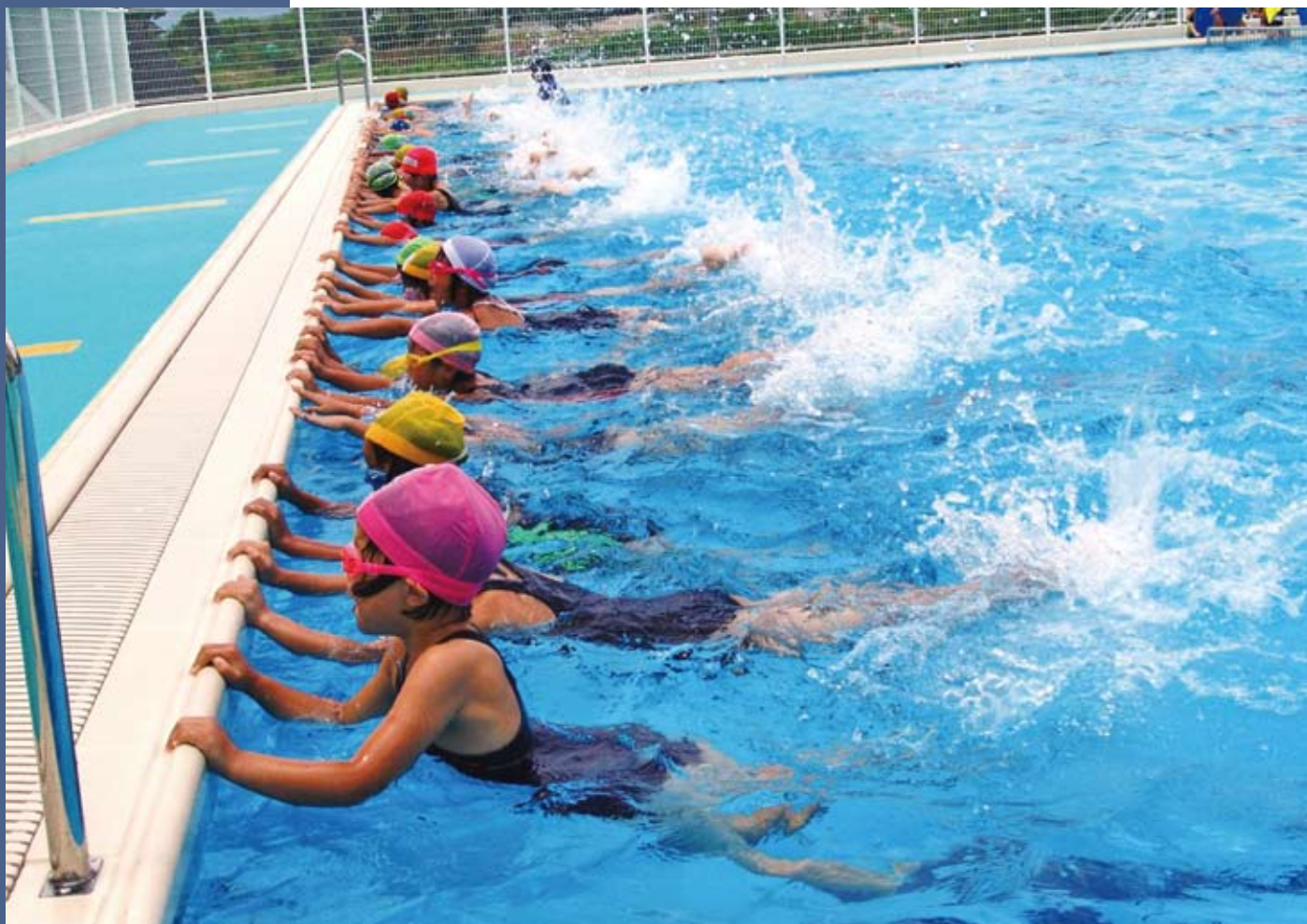
高屋東小学校プール

平成21年第2回定例会は、6月9日から6月29日までの21日間の会期で開催されました。