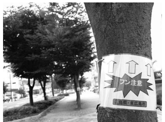
ブルバール沿いの街路樹

①ブルバールは、多くの人が利用する道路であるが、沿道の樹木には多くの鳥が生息し、その排泄物や