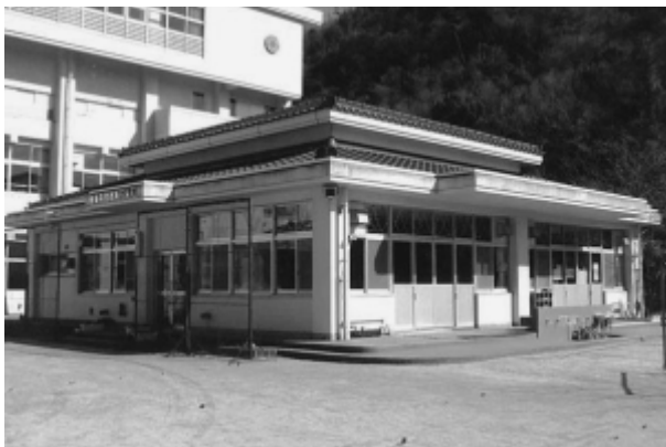
廃止された大田保育所