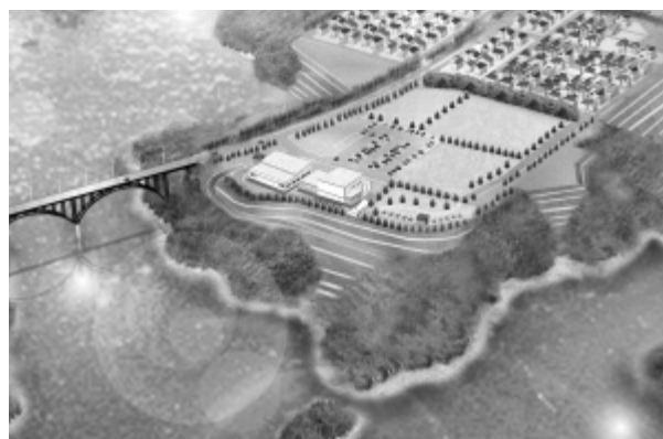
（仮称）福富交流施設の完成予想図

〈反対討論〉 落札率が97・99%に上っている。最初から競争の意思がなかったのではないか。