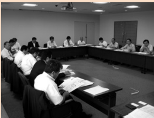
新庁舎建設特別委員会行政視察（岩国市）