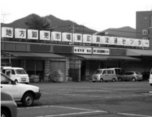
東広島流通センター

この交通安全施設等整備事業は、ダイキョーニシカワ株式会社八本松工場の吉川側に位置し、津江八本松線と市道馬場台4号線の交差点から記念橋西詰交差点までの延長約1200 m区間の歩道整備と記念橋西詰交差点の改良を行うものである。平成6年度に吉川側の歩道整備から着手し、これまでに記念橋西詰交差点を除いて整備を完了している。残る記念橋西詰交差点の改良は、左折専用路で発生した交通事故を教訓に、当初の計画からより安全な交差点計画とするために、現在、見直し作業を行っている。今後、関係機関との協議をはじめとした手続きを進め、今年度中に計画の見直しを完了し、来年度から改良工事に着手する予定と聞いている。