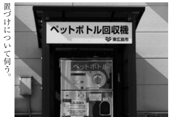
ペットボトルの拠点回収機