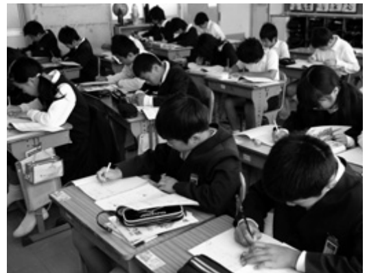
市内の小学校での授業の様子

③県市から本市への移転が決定している独立行政法人産業技術総合研究所中国センターは、移転を機にバイオマス研究を核とした新たな展開が行われると聞くが、本市もこれに参加し、稲のバイオエタノールによる農業活性化や新産業の創設を目指すべきと考えるが、所見を伺う。