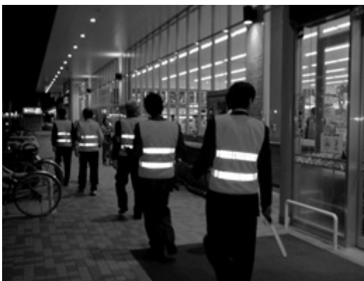
暴走族対策実行委員会による巡視活動

たむろする状況の解消に取り組み、市民総ぐるみで青少年の健全育成を図られるよう、粘り強く取り組みを継続するとともに、国や県、他都市の動向を見極めながら、地球温暖化防止対策としての有効性を含め、各方面のさまざまな議論を注視していきたい。