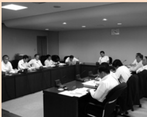
総務委員会行政視察（郡山市）