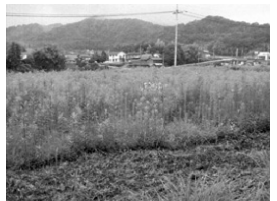
雑草が生い茂る耕作放棄地

現在、本市農業振興の新たな指針となる第二次農業振興計画を策定中であり、長期的な視点から、本市農業の目指すべき方向やそれを実現するための施策を定めることとしている。