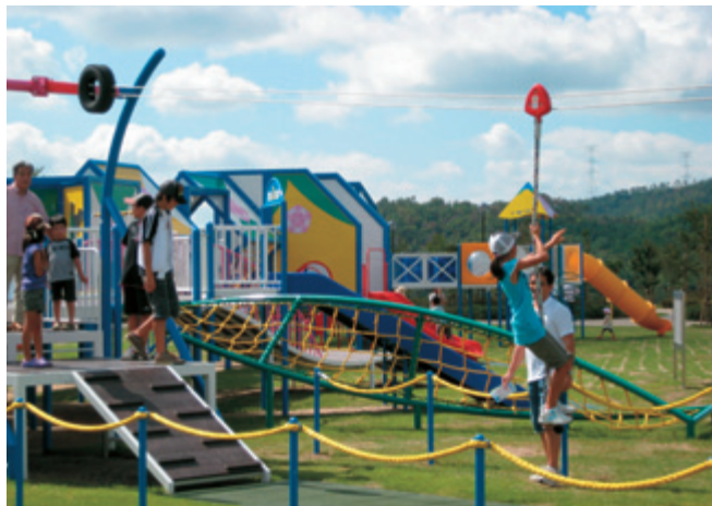
道の駅湖畔の里福富

オープン以降、週末を中心に市外からも多くの方が立ち寄り、福富地区における新たな地域振興、憩いの場となっています。