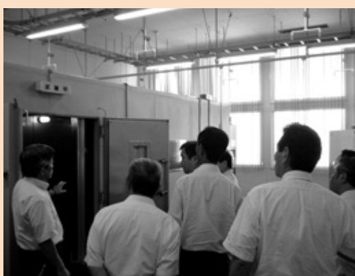
市民経済委員会行政視察（花巻市）

茨城県つくば市では、多様な媒体や交流事業を通じ、まち全体の知名度やイメージアップを図り、地域や産業を活性化させている「シテイセールス」の取り組みについて視察した。