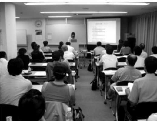
コラボスクエアでの中小商工業者向けセミナー

国や県の経済情勢が厳しい中、本市内の商工業者も厳しい状況にあることは認識している。今後は、成長都市といわれる本市の成果を地域に広く行き渡らせ、活性化することが課題だと考えている。そこで、市内3大学、商工会議所とともに、産学官連携推進協議会を設置し、中小企業と大学等とのネットワークを深め、地域企業の研究開発型企業への転換や新規成長分野への進出を支援