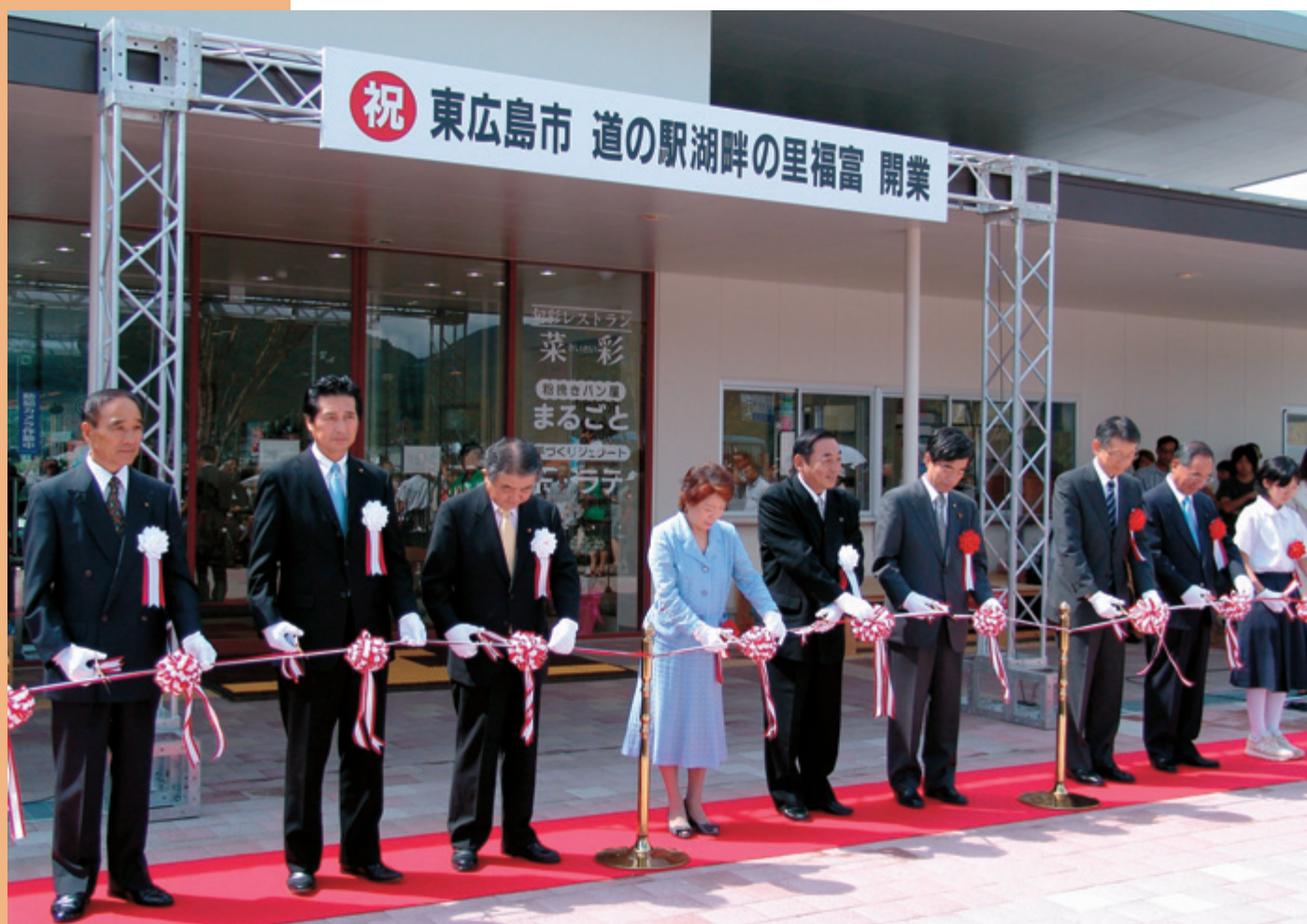
道の駅 湖畔の里福富オープニングセレモニー

平成20年第3回定例会は、9月8日から25日までの18日間の会期で開催されました。