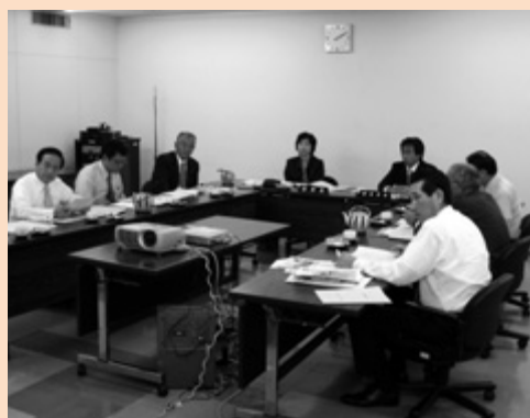
議会会報委員会行政視察（磐田市）

静岡県磐田市、京都府宇治市において、議会情報をより多くの市民に伝えるための「議会ホームページの編集等」について、視察を行った。