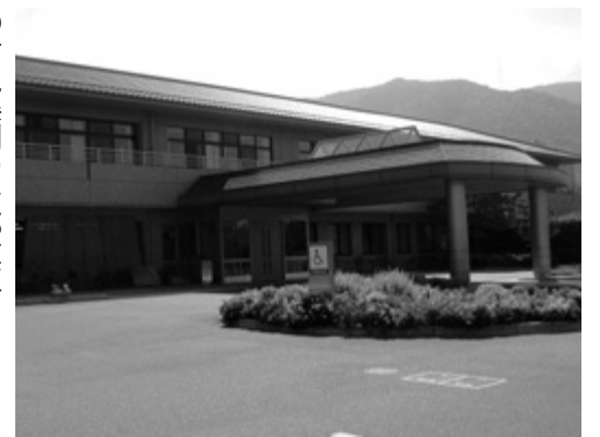
介護老人保健施設 もみじ園

公益法人等への一般職の地方公務員の派遣等に関する法律の一部改正に伴い、条例において引用している用語を整理するもの。