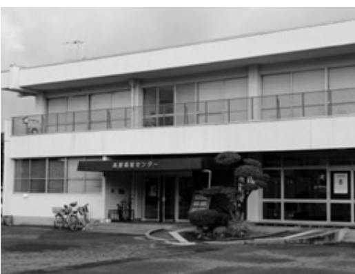
高屋福祉センター

JA広島中央高屋支店については、建物や土地の形状、面積等の諸課題があるため、すぐには利活用できないと判断している。今後は、高屋福祉センターや高屋出張所機能のあり方も合わせ、総合的に検討する。