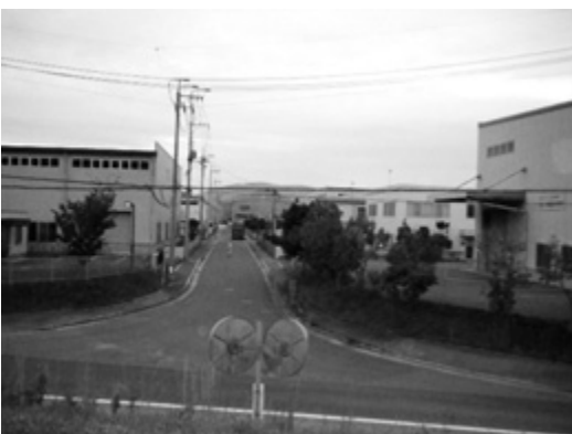
住居表示が実施されている黒瀬工業団地

なお、住居表示を実施する市街地の区域のうち、実際に住居表示を実施した区域の面積は約1842haで、実施率は53.8%である。