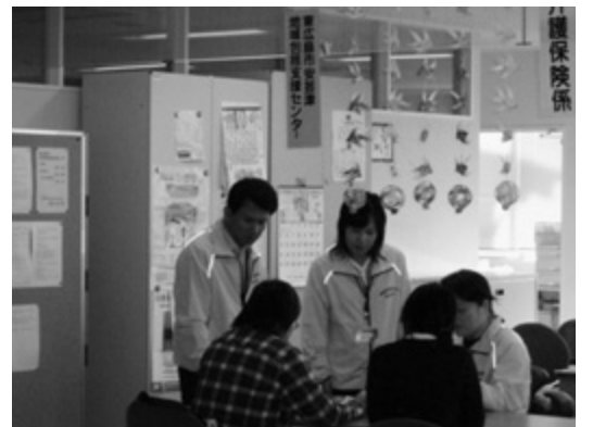
安芸津地域包括支援センター

地域包括支援センターは、市内6か所に設置し、専門職員を配置して、高齢者の総合相談などに取り組んでいる。昨年度の相談件数は1966