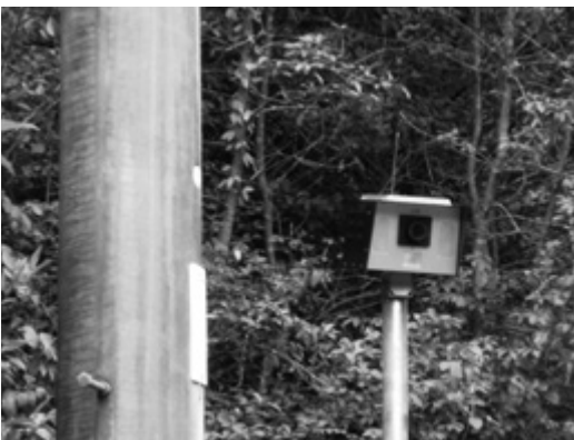
不法投棄を防ぐための監視カメラ

②今年度新規に模擬カメラを含め、慢性的に不法投棄が行われる4か所に設置を予定している。設置後の効果を検証しながら、引き続き設置を検討していきたい。昨年10月の家庭系ごみ指定袋導入後、ごみの量は前年比で5%減少し、分別も良好に行われている。指定袋の種類を増やすことは、要望もなく、現時点では考えていない。現在のところ、焼却されるごみのプラスチック混入率、発熱量ともに想定値を下回っており、焼却炉への影響はない。