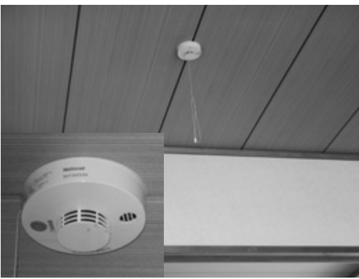
市営住宅に設置されている火災報知器

新エネルギー開発は、専門的な技術職員が不在ということなどから、現段階では、難しいと考えている。今後、太陽光発電などの普及啓発、公共施設への太陽光発電の整備、クリーンエネルギー車などの先導的な導入を進めるとともに、産学官の連携による研究などの推進、市内企業の新エネルギー関連技術開発への取り組みなどを支援していきたい。