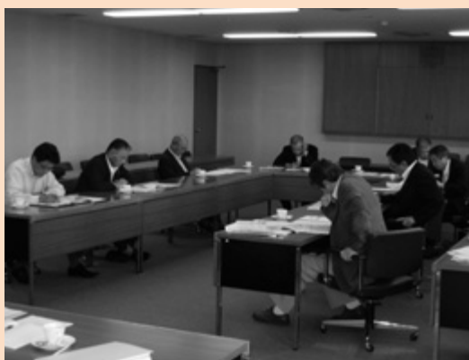
建設委員会行政視察（長岡市）

これらの視察を行った事業を参考として、本市のまちづくりに反映していきたいように努力したい。