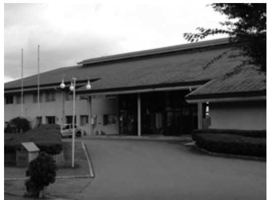
被爆資料展示施設が入っている松翠苑

②新庁舎には、単に事務所としての執務空間機能を求めるだけでなく、市民交流や市民協働の場となるような庁舎を目指すべきと考えており、今後は、設計者選定を行う中で予定されている基本設計や実施設計などの各段階において、市民の声を