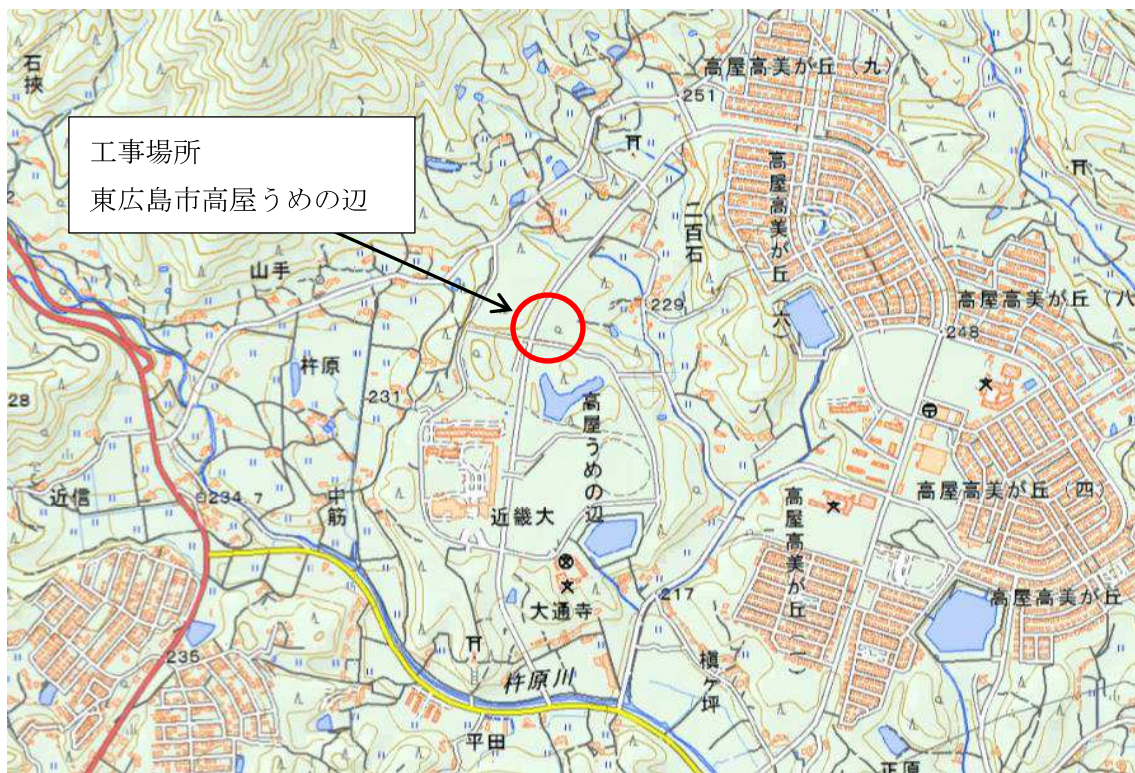
(仮称) 東広島消防署高屋分署造成工事 位置図