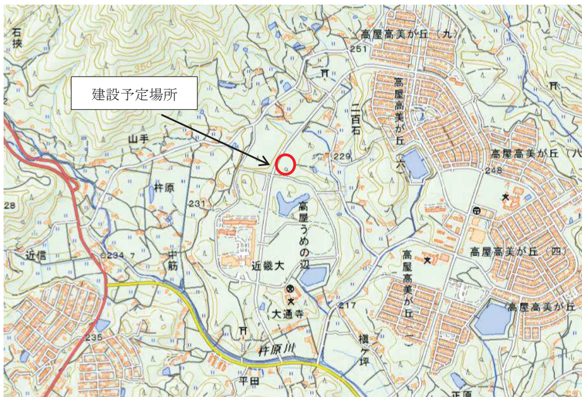
(仮称) 東広島消防署高屋分署新築工事 (建築) その2 位置図