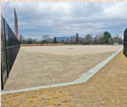
東広島運動公園 野球練習場

A 規模は、面積が約3,400平方メートルで、利用については、隣接している野球場にあわせて練習できるように工夫しているが、多目的でも利用できる。