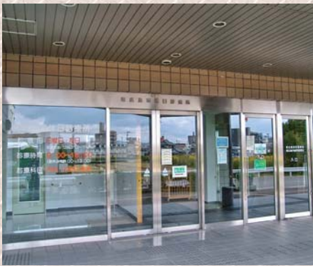
東広島市休日診療所

「在宅当番での運用をできないか」と打診があった。医療資源には限りがあり、市民サービスの著しい低下につながるかと判断して、医師会の意向に沿う形で条例改正を行った。