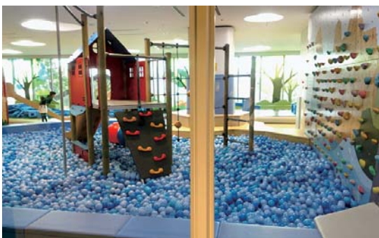
ポーネルンド(民間企業)が運営している子どもの遊び場

今年度、社会貢献活動やまちづくり活動をはじめとする学生の自主的な活動を応援する補助金を創設し、交通費も対象としている。議員ご指摘のシェアリングエコノミーといったアイデアも参考として、学生や大学の意見を聴きながら、学生が地域参加しやすい環境づくりに努める。