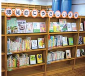
認知症にやさしい本棚

認知症力フェの普及が進んでいないことは課題として認識している。来年度末までに市内に10力所の開設を目標に掲げ、土壌づくりに取り組んでいる。既存の認知症力フェ