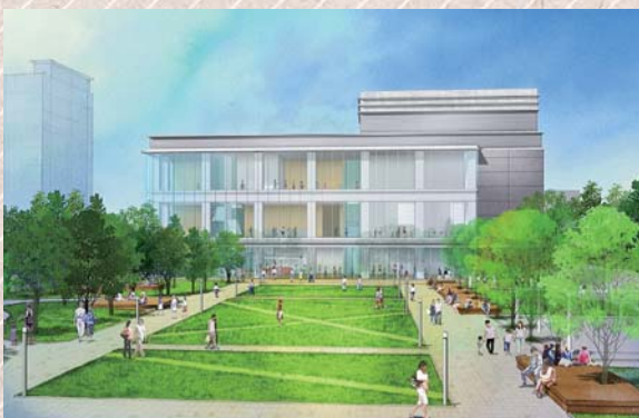
新東広島市立美術館完成予想図