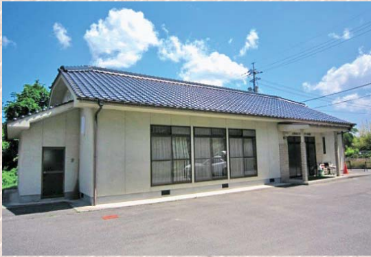
地元譲渡される地域集会所（上保田会館）

A 施設の地元譲渡に伴う 市の補助制度を活用し、 地元と調整しながら、修繕を進 めていく。