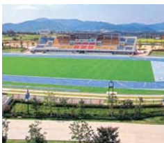
東広島運動公園 陸上競技場

陸上競技場のトラック舗装部分については、年度末の工事完成後から段階的に利用できるよう調整していきたい。夜間照明については、高額な費用を必要とするため、現時点での対応は難しい。ネーミングライツについては、他市町の同規模施設での導入状況を把握し、検討を行っていく。