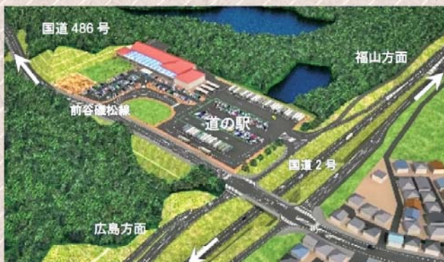
（仮称）道の駅西条完成予想図