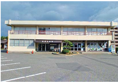
高屋西地域センター

能や市民の利便性、市民相互の交流によるまちの賑わいに資する施設として考えた場合、