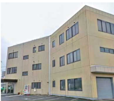
水道局舎・倉庫棟

平成29年度に耐震診断を行った結果、防災拠点施設としての耐震性能の基準を下回っていることが判明した。水道事業の広域連携の動向により水道局舎の活用方針が左右されることや、耐震補強工事や建替えには多額の費用と時間を要するため、当面保留する。