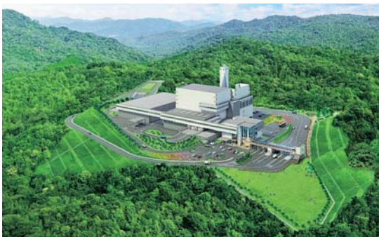
広島中央エコパークイメージ図

現在、広島中央環境衛生組合の構成市町2市1町により、「広島中央エコパークの供用に伴うプロジェクトチーム」を発足させ、ごみ分別方法について検討を重ねているところである。リサイクルできるものは引き続きリサイクル処理を行い、市民にとってできるだけ分かりやすく、負担軽減につながるような分別方法等となるよう検討を進めていき、今年度末までに方向性を示したい。