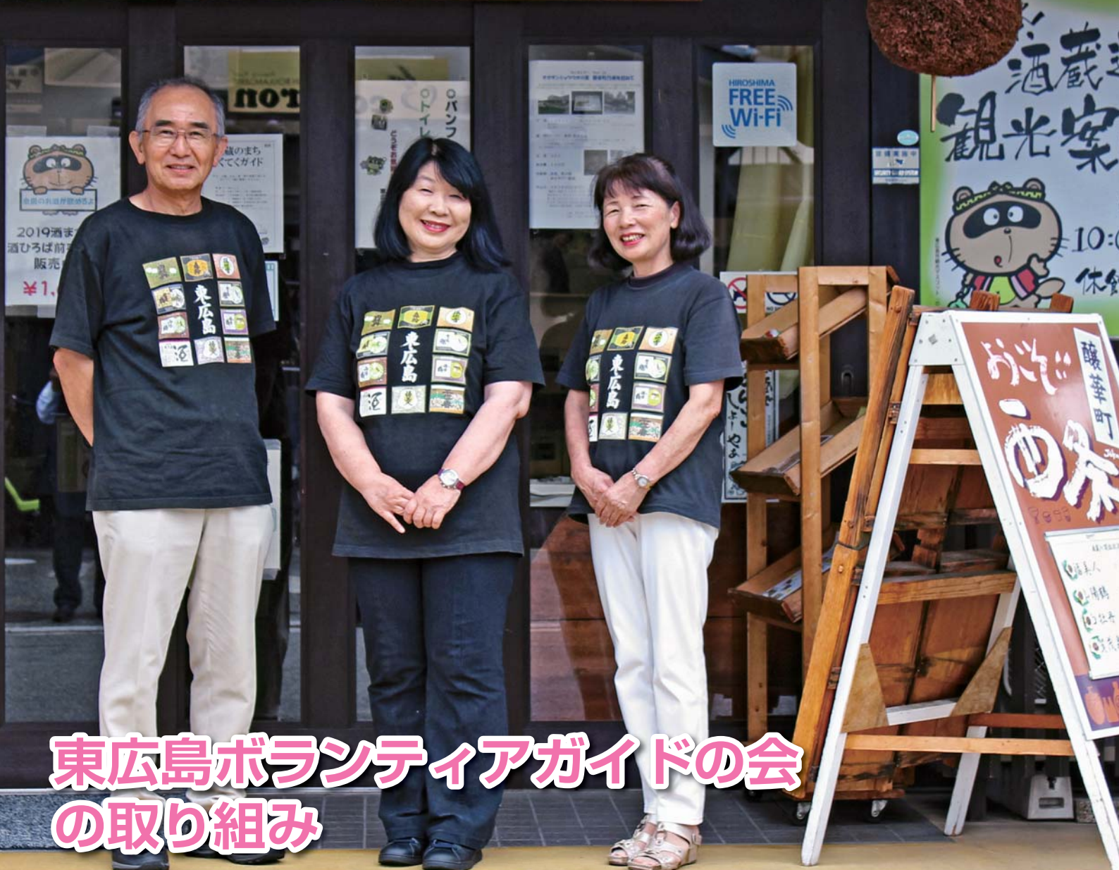
東広島ボランティアガイドの会の取り組み