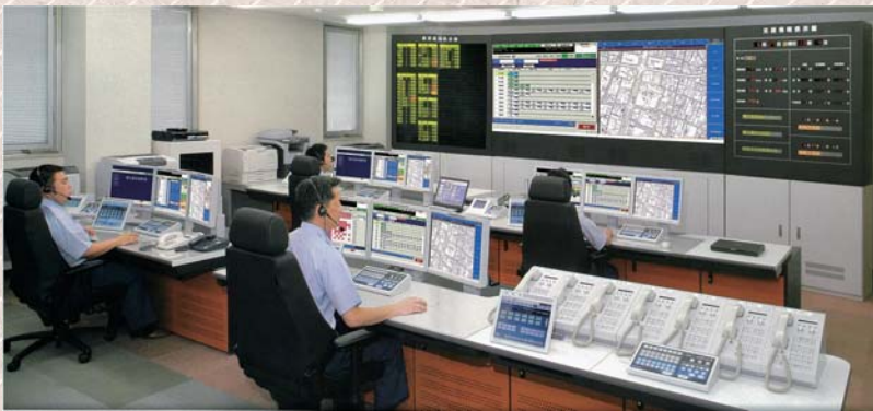
高機能消防指令センター