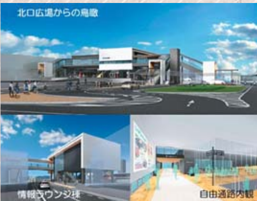
西高屋駅イメージ図

A 都市計画マスタープランの作成を進める中で、地域住民とのワークショップなどを通じてまちづくりの将来像を考えていきたい。