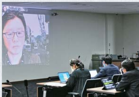
オンライン研修の様子

検証の結果、災害時の議会対応を基本条例に定めることのほか、議案等や委員会記録のホームページでの公開、議決を必要とする市の計画の見直し、議会の政策研究機能強化のための政策研究会の見直しを行いました。