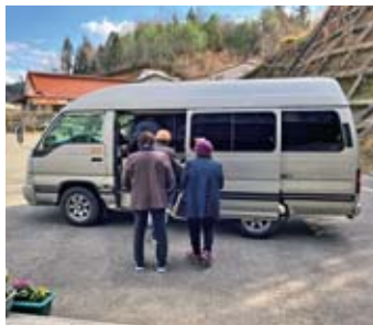
河内町入野で運行中の入野デマンドバス