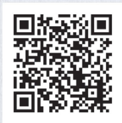
YouTubeの本会議動画一覧のQRコード

コロナ禍での議会運営上の課題、議会権能を維持していく上での留意点、ICT化の位置づけ、他市の事例について、わかりやすく説明いただきました。