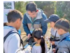
広島国際大学の先生と葉っぱの種類を確認

感で感じながら、新しいことに挑 戦します。保護者からも「普段見 られない子どもの表情が見られた 」と好評で、自然体験の大切さを改 めて感じる機会となっています。