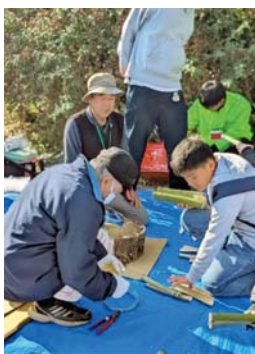
地域の方に竹馬の作り方を 教わります

この森では、学び・体験・遊び が重なり合い、自然と多世代の交 流が生まれます。今後は森の地形 を活かした散策路づくりや焚き火 体験、デイキャンプ、サイクリン グなど、気軽に楽しめるアウトド ア体験を広げていく予定です。自 然の中での予想外の出来事や発見 は、子どもたちが考え、工夫し、 助け合う力を育み、「生きる力」 を育てる場にもつながると期待さ れています。