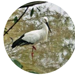
池に飛来したコウノトリ

活かし、人が集まる場所をつくれ ないか」という思いから生まれた のが「黒瀬まちづくり会」です。 池や山林、黒瀬コスモス園周辺の 土地を一つのフィールドとして活用 し、地域の魅力を活かした新しい まちづくりの活動が始まりました。