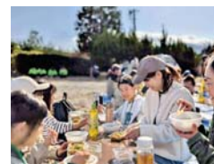
参加児童・保護者・スタッフが交流

この森では、学び・体験・遊び が重なり合い、自然と多世代の交 流が生まれます。今後は森の地形 を活かした散策路づくりや焚き火 体験、デイキャンプ、サイクリン グなど、気軽に楽しめるアウトド ア体験を広げていく予定です。自 然の中での予想外の出来事や発見 は、子どもたちが考え、工夫し、 助け合う力を育み、「生きる力」 を育てる場にもつながると期待さ れています。