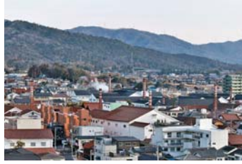
酒蔵が並ぶ街並み

で検討を重ねている。また、協議会の構成員でもあるディスカバー東広島を中心に観光スポットの開発に向けた検討を進めている。②文化的価値を高めることと観光地としての魅力を向上させることを両立していく。