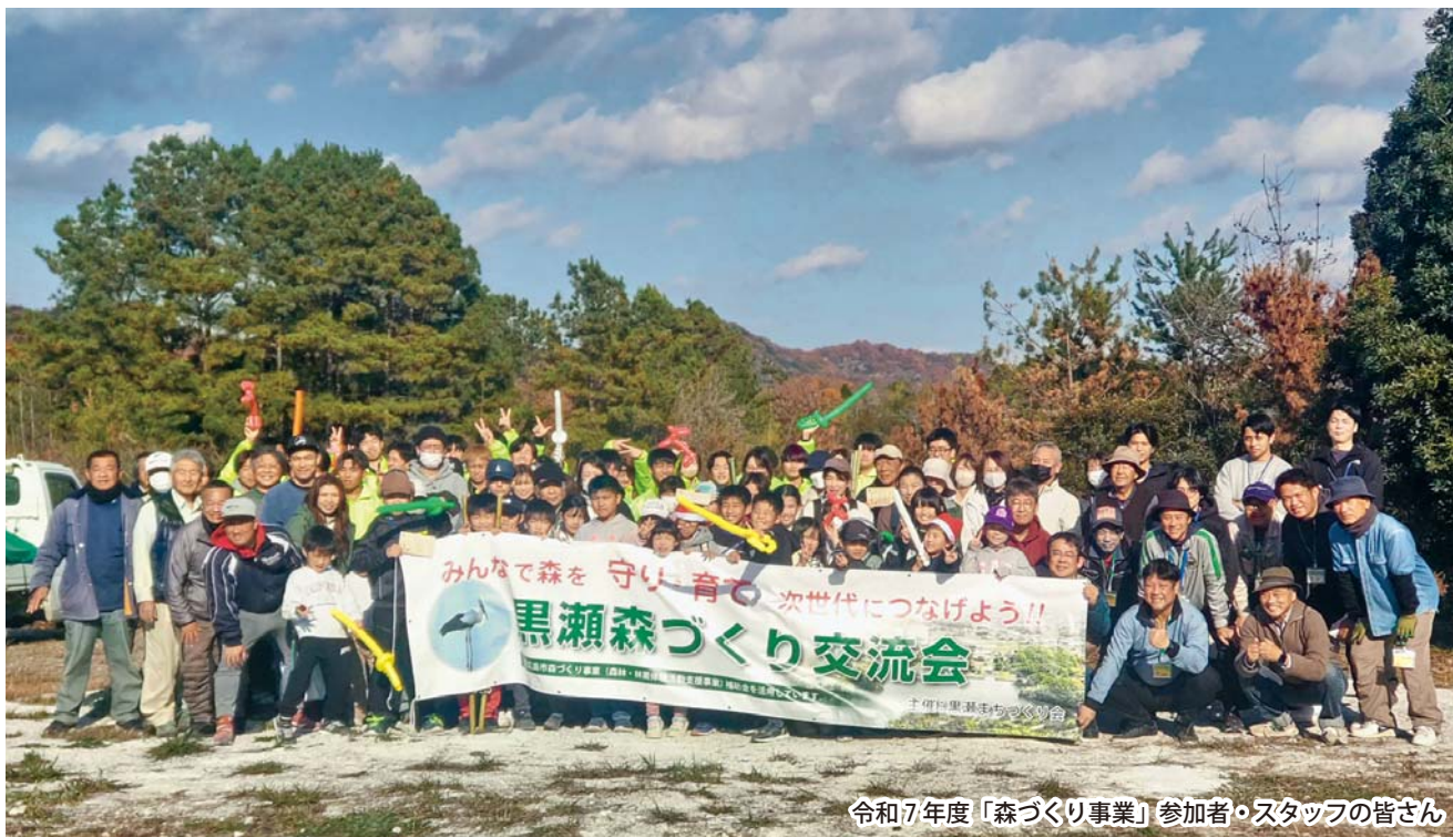
令和7年度「森づくり事業」参加者・スタッフの皆さん