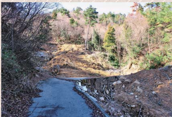
平成30年7月豪雨災害によって崩れた道路