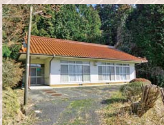
無償譲渡される西の谷老人集会所