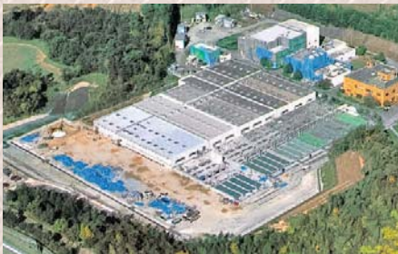
東広島浄化センター

A 今回の処理場増設については、基本協定を締結しておらず、工事ごとに年次実施協定で事業を進めている。工事の全体額については大きな変更はない。