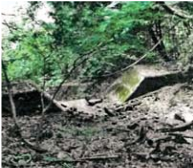
治山ダム (河内町戸野)

持する治山ダムが650基、水の流を固定し浸食を防ぐ護岸工・流路工が75基整備されている。そのうち、森林が再生した箇所としては、構造物に