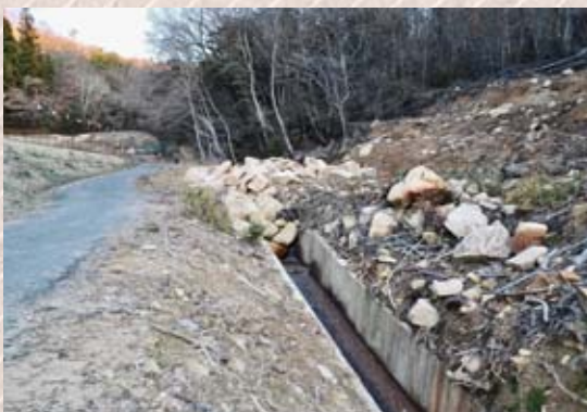
土砂が流れ込んだ道路と側溝