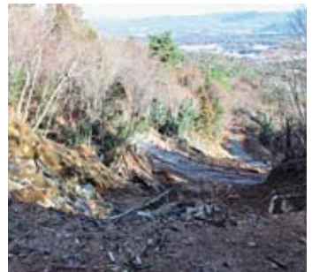
平成30年7月豪雨災害による 市内の被災状況