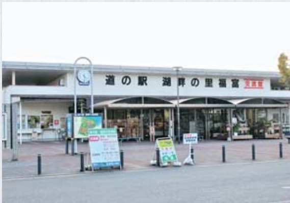
道の駅 湖畔の里福富

これまでに、東広島地区医師会との意見交換会、市の執行部からの現状の聴取を実施しています。