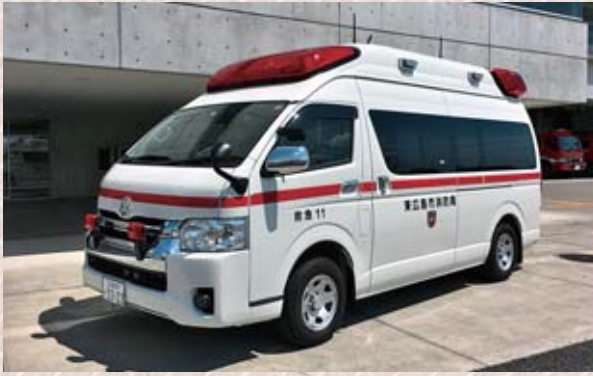
高規格救急自動車