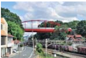
令和元年度に橋梁の修繕を行った八本松大橋

財政制約の中でどういったアセットマネジメントが展開できるかという議論は十分ではなかった。今後、個別計画が集約されて、その中で優先順位を考えながら、長期的な制約の中でどのようにアセットマネジメントを展開していくのかということをしつかり考えていく必要がある。