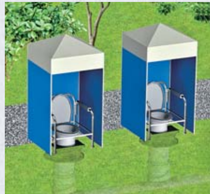
※マンホールトイレ

「道の駅の管理運営について」のテーマについては、これから本格的に調査を実施します。