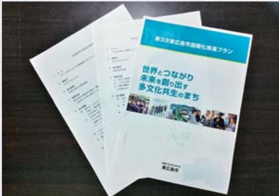
所管事務調査の各種資料