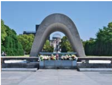
平和記念公園の原爆死没者慰霊碑

広島、長崎に原爆が投下されて75年を迎えた。二度と戦争の惨禍、核兵器という過ちを繰り返さないために平和教育は重要である。被爆者の高齢化が進む中で被爆体験を継承することが問われている。児童生徒の発達段階に応じた平和教育の概要について伺う。