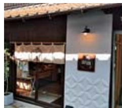
西条駅前の古民家を改修したチョコレート店

③すでに中心市街地では空き店舗活用の実績があり、今後は※コワーキングスペース誘致や広島大学に設置した※タウンアンドガウンオフィス準備室で空き家活用の取組みなどを進める。空き地や空き店舗の活用は地区の魅力の向上にもつながることから、他自治体の事例を研究していく。