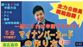
本市若手職員による ユーチューブ動画

SNSでの情報発信にはインフルエンサーの活用も有効と考える。動画による情報発信や若年層の感覚・発想も必要である。若い職員の発想も