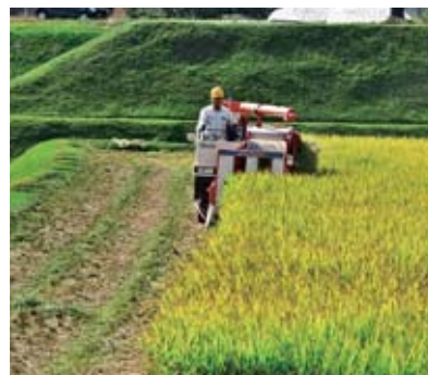
市内での農作業の様子

進を図るとともに、本市産米の地消への取組みについても役割分担を行いながら検討していく。