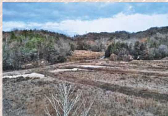
土砂が流れ込んだ農地