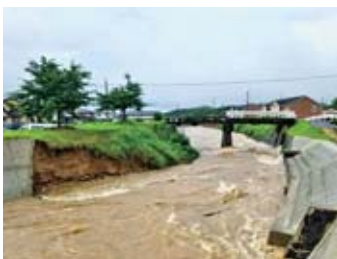
復旧工事完了箇所の横が崩れた黒瀬川の堤防

災害復旧は国の査定を受けて工事内容が決定し、原形復旧を基本としているため、復旧箇所の変更は認められていない。災害予防は復旧と維持修繕により取り組むこととし、復旧工事の早期完了と、危険が判明した場合の補修に努めていく。