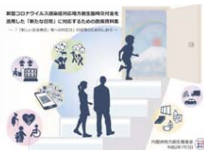
政策資料集「地域未来構想20」