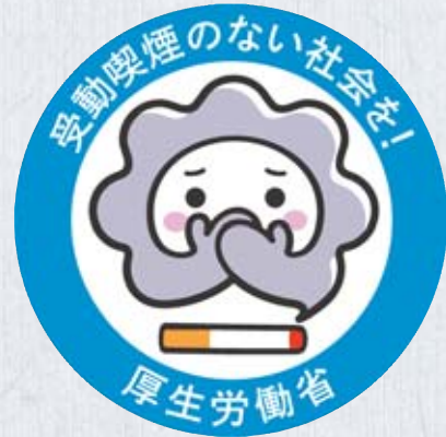
「受動喫煙のない社会を目指して」ロゴマーク

これまでに、市の執行部からの現状の聴取、委員間協議での論点整理などを実施しています。