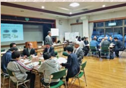
昨年度に実施した市民経済委員会の議会報告会の様子

議会報告会は二部構成としており、第一部で議会側からの報告を行い、第二部では参加者の方々と議員が数グループに分かれて意見交換を行うものです。一日も早く、新型コロナウイルス感染症が終息し、議会報告会が開催できるよう、本市議会も全力で取り組んでまいります。