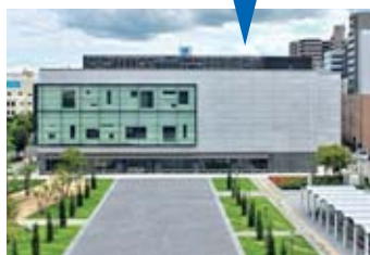
東広島市立美術館