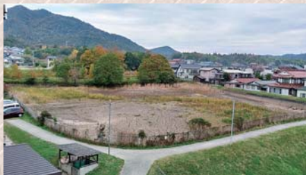
造成工事を行う調整池