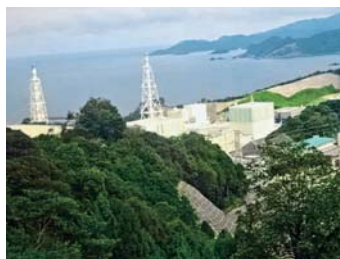
島根原子力発電所 (島根県松江市)