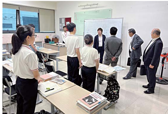
JIS人材開発株式会社－実習先の公衆衛生大学にて