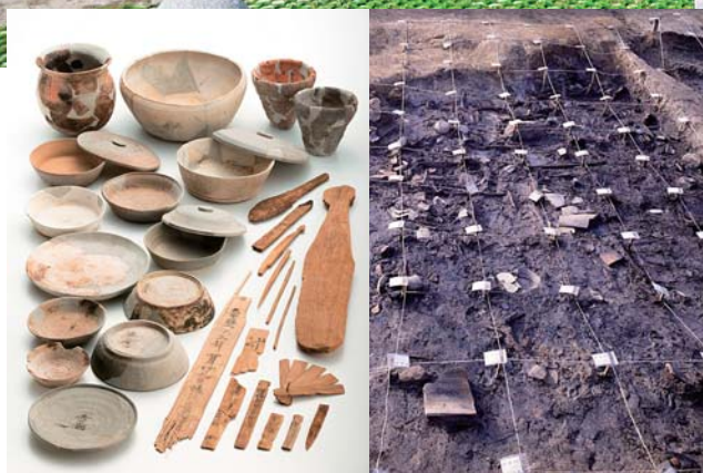
広島県安芸国分寺跡土坑出土品(左)と出土した土坑(右)

令和4年11月18日に開催された国の文化審議会において、「広島県安芸国分寺跡土坑出土品」が、新たに国の重要文化財（美術工芸品：考古資料）に指定される答申がなされました。時期が極めて限定された一括出土品であり学術的価値は高く、今後、3月に本市出土文化財管理センターでの展示公開、5月ごろに市立美術館での展示公開が計画されています。