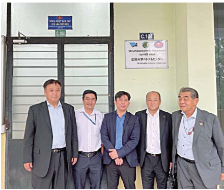
広島大学ベトナムセンター

しかし、数年前に民間交流団体が大学内で酒まつりを実施したところ、他の大学が興味を持ち、自分の大学でも実施したいとの申し出があり、また、介護人材の送り出し機関から広島県、東広島市と連携を図りたいとの話もあることから、東広島市へも強い関心があることを感じることがお互いのメリットとなると考えているとのことでした。今後も、広島大学ベトナムセンターと連携し、積極的に交流を図ることで、本市を身近に感じてもらおう取組みを進めるべきと考えます。