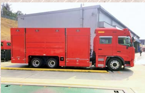
化学消防ポンプ自動車

A 東広島消防署、竹原消防署、大崎上島消防署に各1台で、国の基準により適正に配置している。