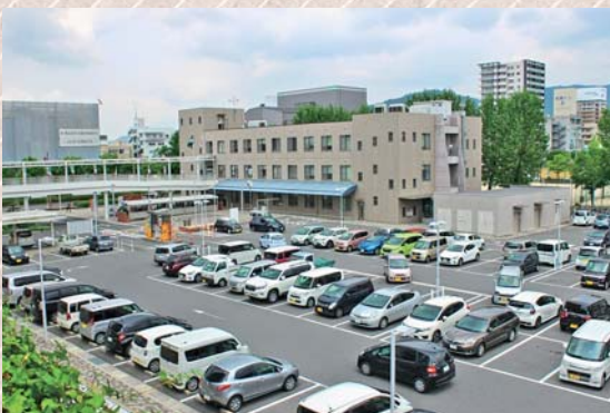
東広島市庁舎駐車場

地方自治体は課税団体ではないため消費税を支払う必要はないが、消費税分が上乗せされるため必要経費が上がってくるということでこの処理をしていると理解している。消費税は廃止すべきだと思っているが、民主主義のルールにのっとり、地方は国が決めたことに従うしかないという状況であるため、賛成する。