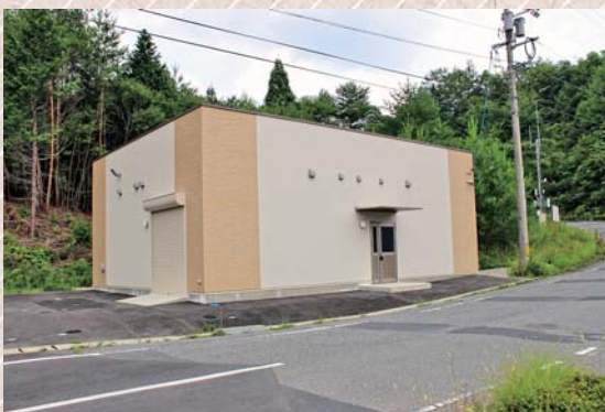
有害獣処理加工施設の外観