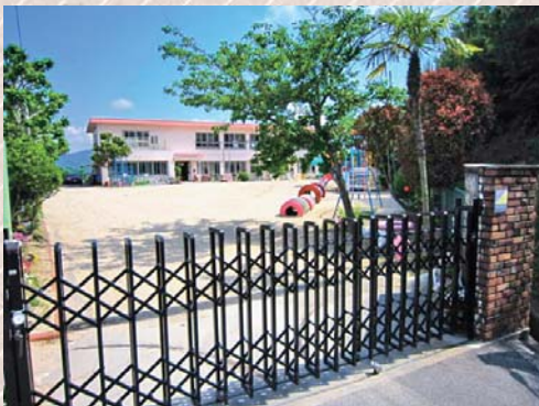
移転・民営化される円城寺保育所

反対討論中の円城寺保育所の民営化については、公立・民間トータルで定員の枠をふやして待機児童対策を進めていくため