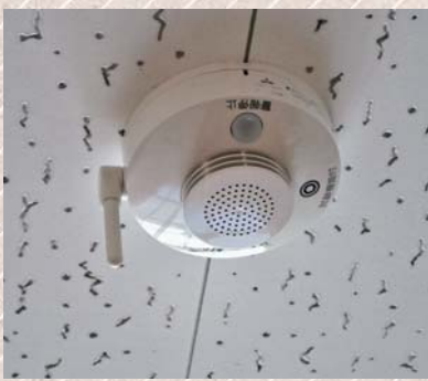
特定小規模施設用自動火災報知設備

A 住宅用の防災警報器を設けなければならない場所に、機能的に上位の設備を設けた場合は、住宅用の防災警報器の設置が不要であるということである。