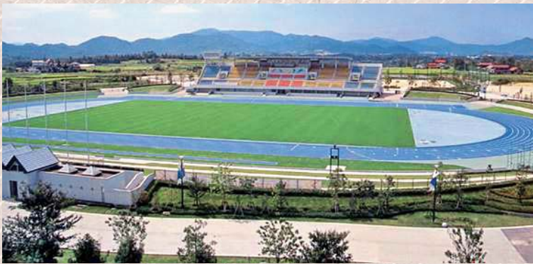
東広島運動公園陸上競技場（改修前）