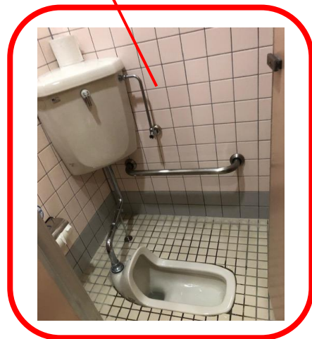
写真2：女子トイレ全景