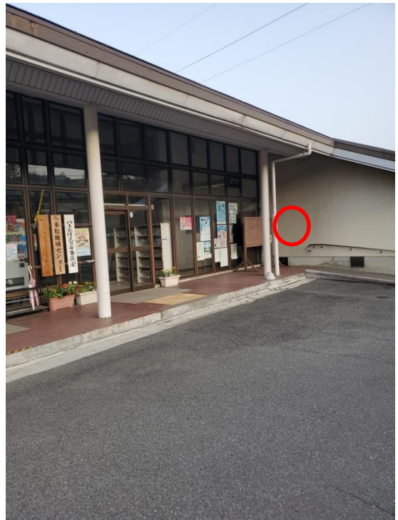
八本松地域センター