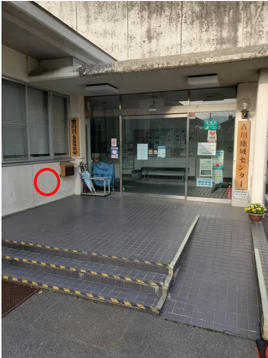
吉川地域センター