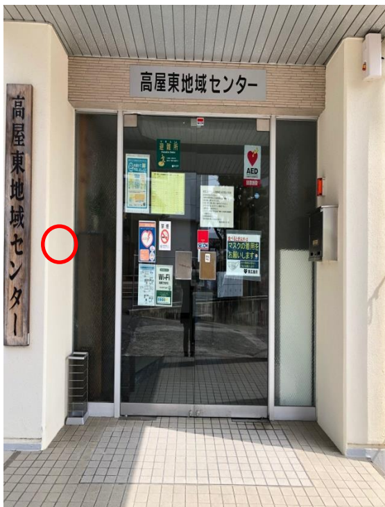
高屋東地域センター