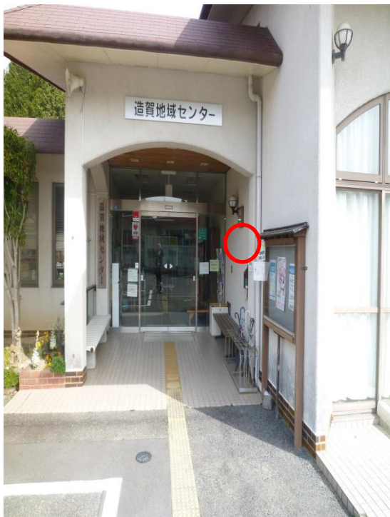
造賀地域センター