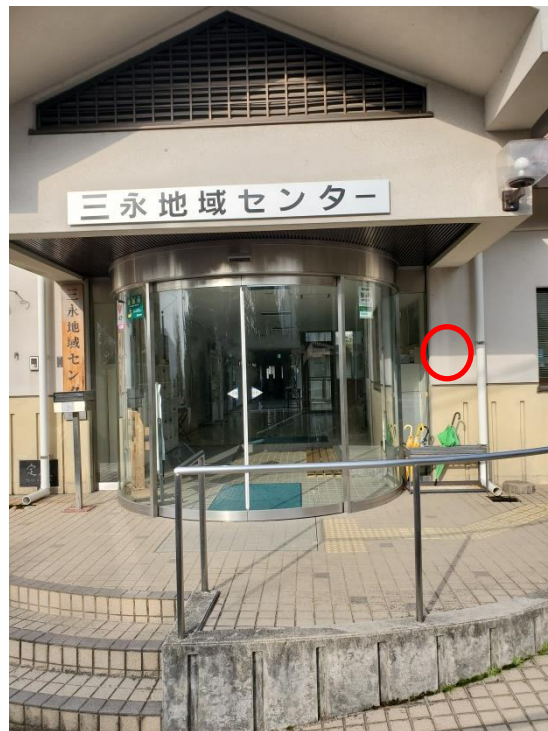
三永地域センター