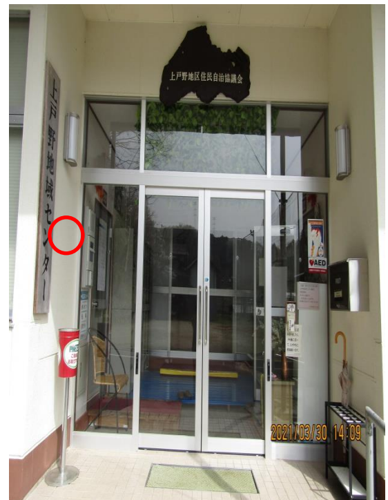
上戸野地域センター