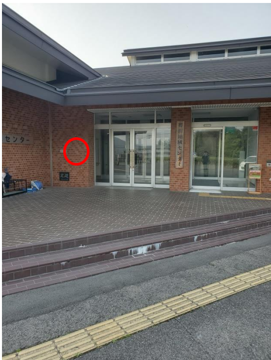
郷田地域センター