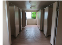
①改修希望箇所 入口から左側3か所