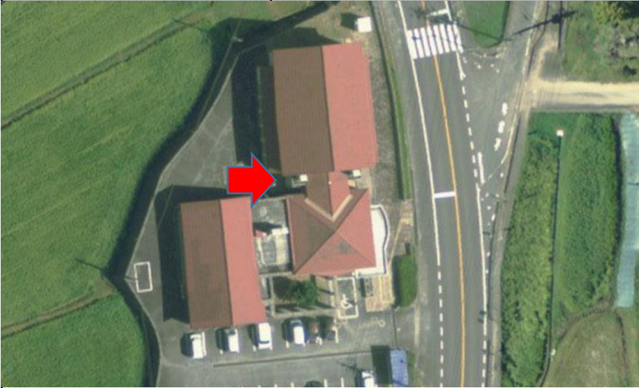
東志和地域センター