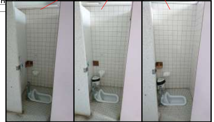
2階女子トイレ 手前から2,3,4番目