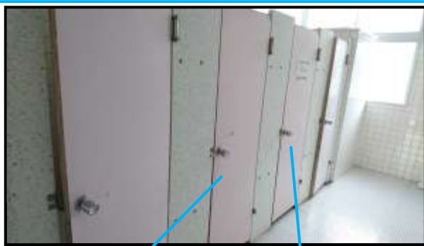
1階女子トイレ 手前から2,3番目