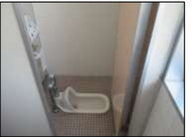
3F 女子トイレ ①左側 奥2つ