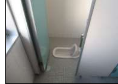
3F 男子トイレ ①右側 奥1つ