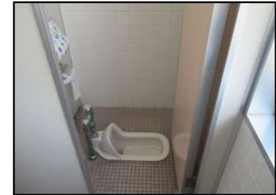
2F 女子トイレ ①左側 奥1つ