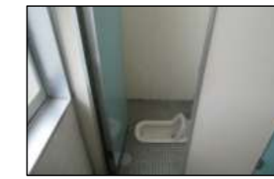
2F 男子トイレ ①右側 奥1つ