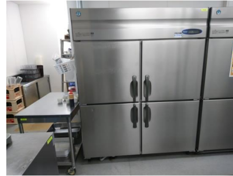
【No. 1】 冷蔵庫