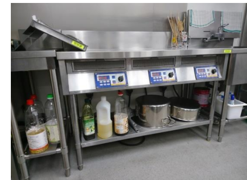
【No. 5】 電磁調理器