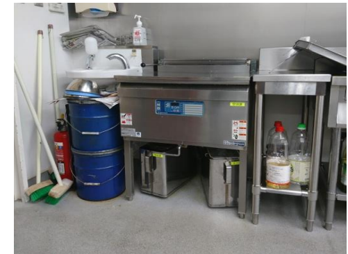
【No. 4】 フライヤー