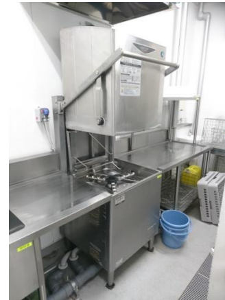
【No. 3】 食器洗浄機