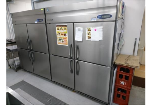
【No. 2】 冷凍庫