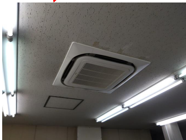
図 3 : 対象設備 (室内機)