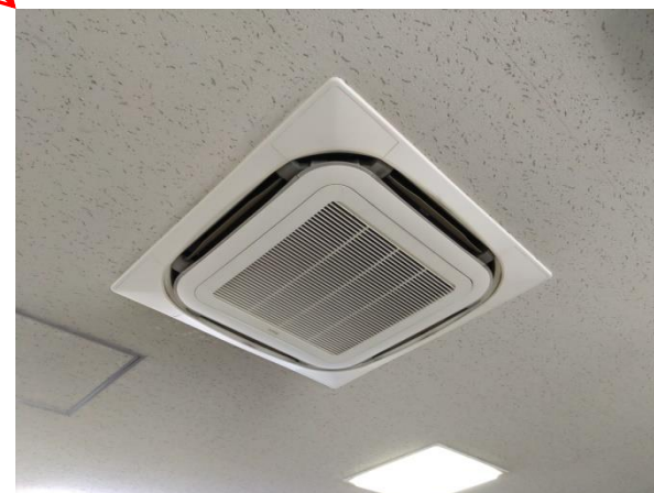
図 4 : 対象設備 (室内機)