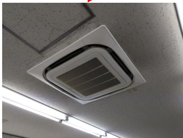
図 2 : 対象設備 (室内機)