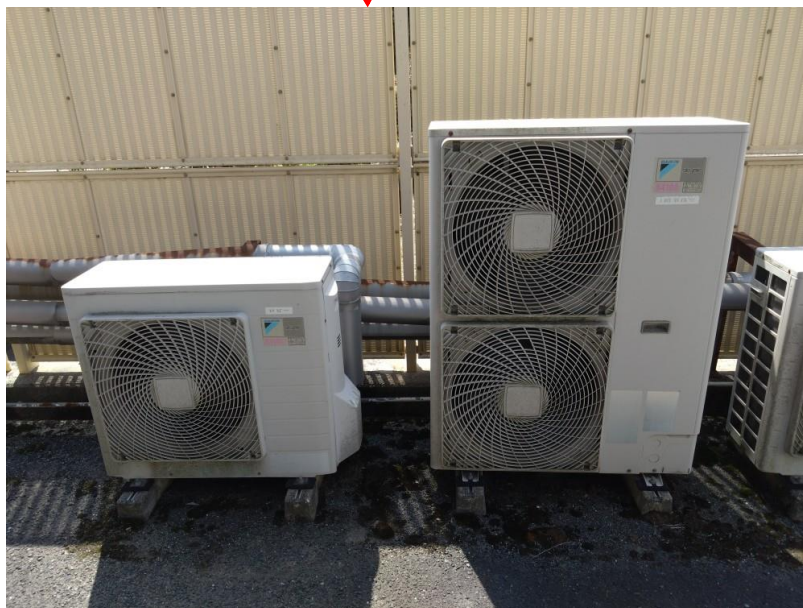
図1：対象設備（室外機）