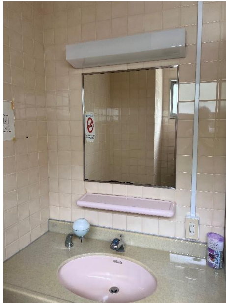
・男子シャワー室