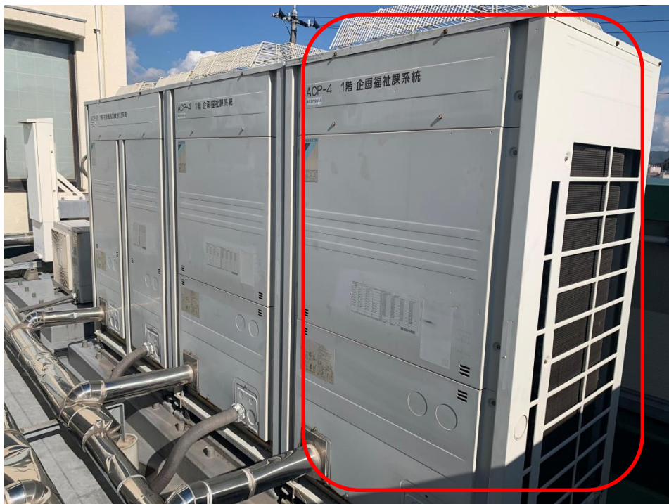
1階企画福祉課系統（右側）