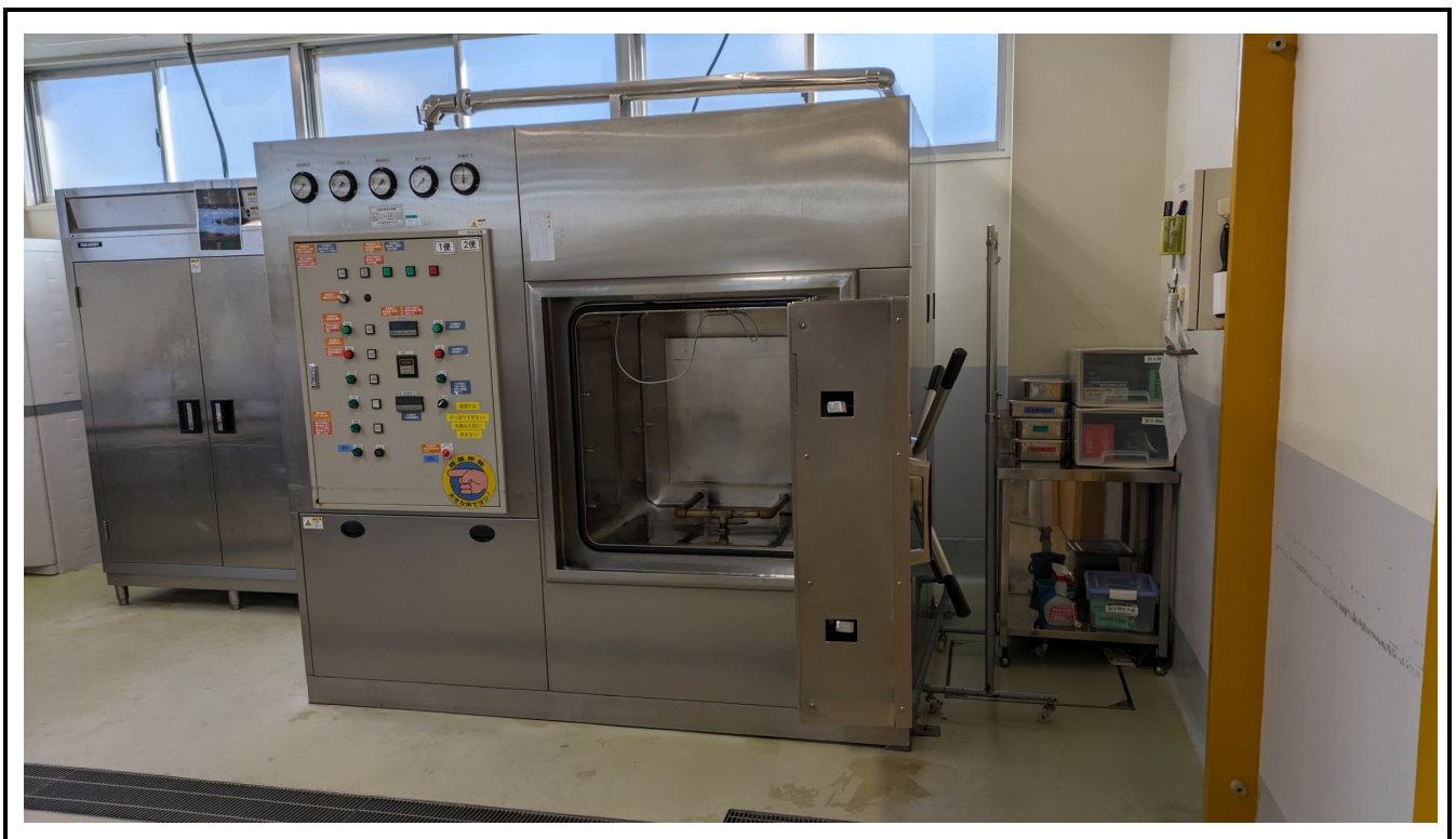
既存蒸煮冷却機 (和え物室)