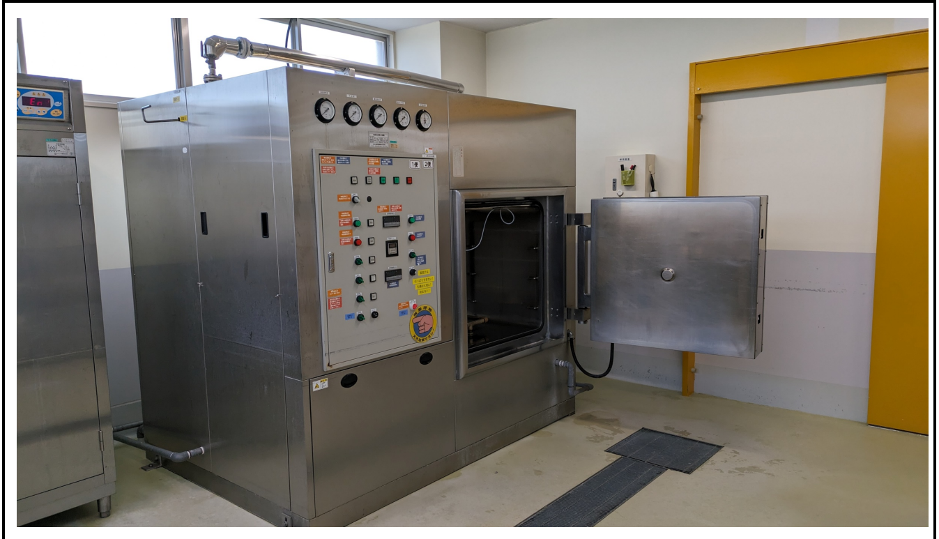
既存蒸煮冷却機 日本調理機 NSCT-60 外寸 W2020mm×L1670mm×H1900mm