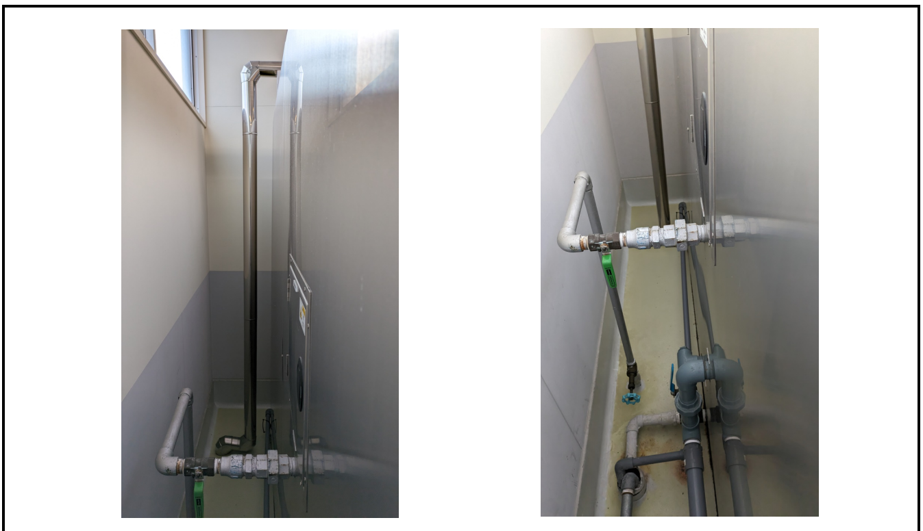
既存蒸煮冷却機背面 (和え物室)