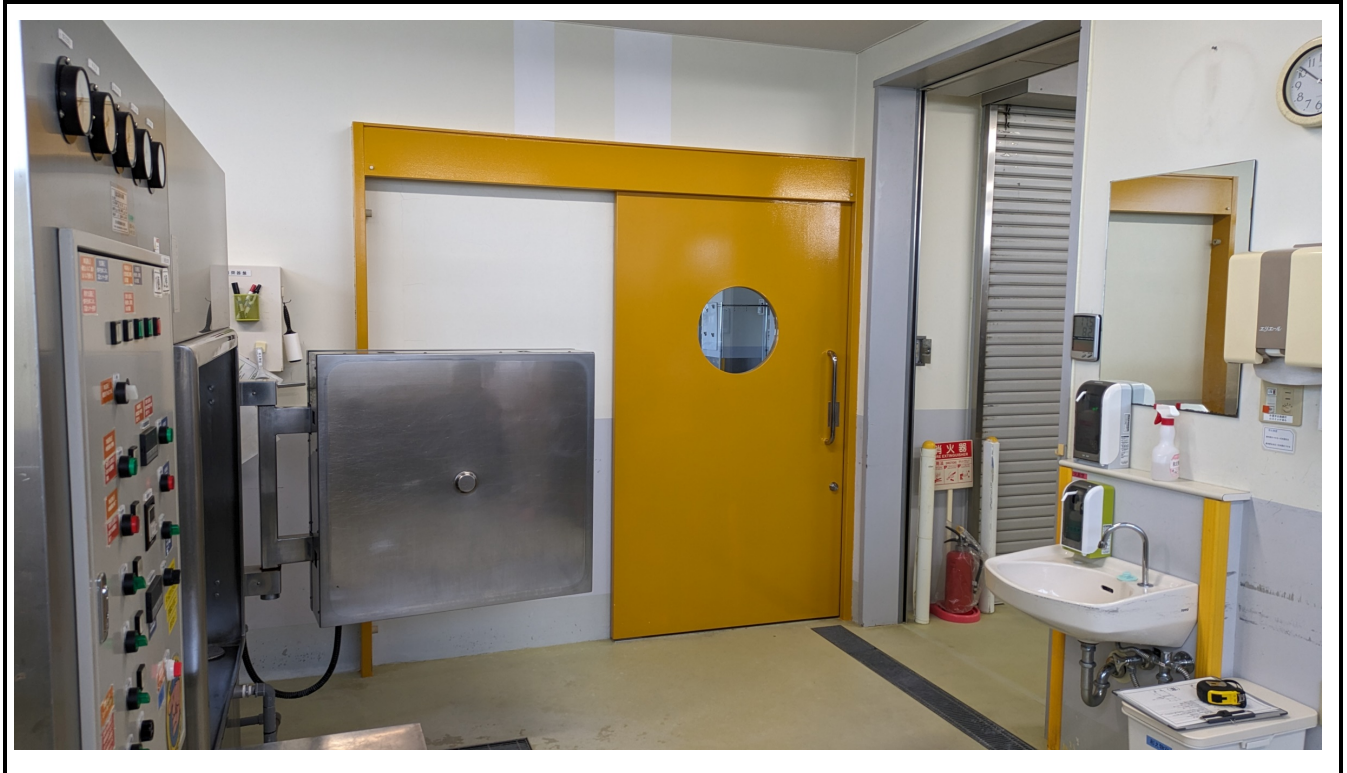
シャッター 開口 W1200mm×H2495mm