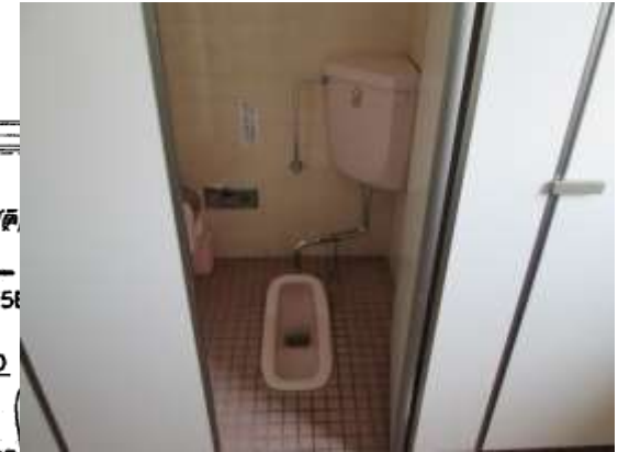
写真4：女子トイレ最奥全景