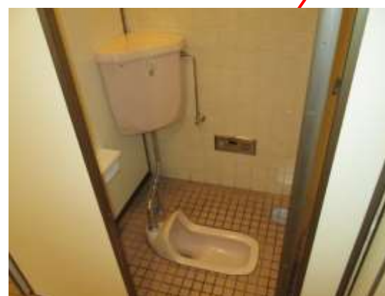
写真2：女子トイレ最奥全景