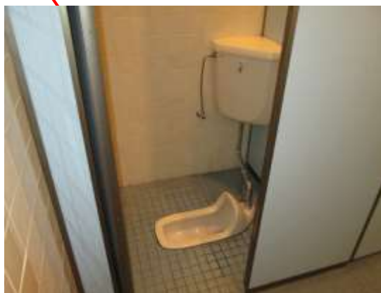
写真1：男子トイレ最奥全景