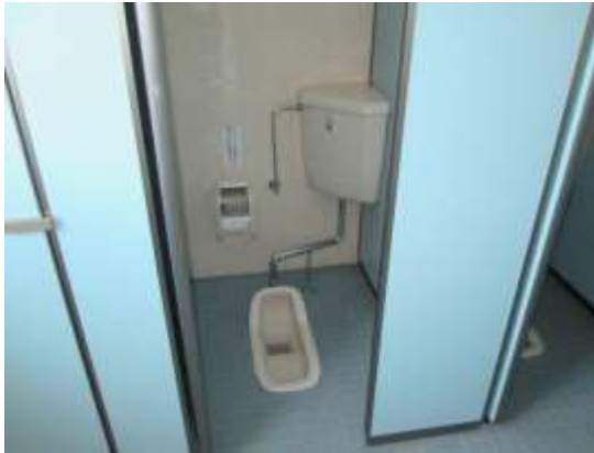
写真3：男子トイレ最奥全景