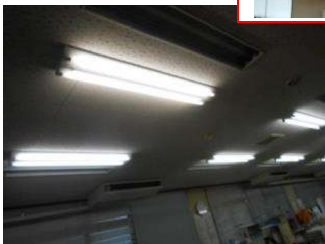
使用中の既存照明 (FSA42001F VPH9) 18 台と 使用していない既存照明 (FR-4249F-200H) 16 台