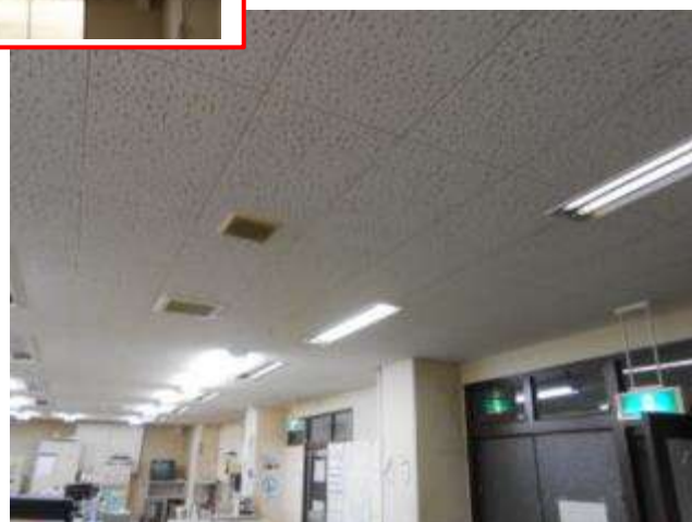
使用中の既存照明 (FR-4249F-200H) 2 台