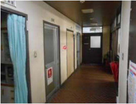
身体障害者用便所