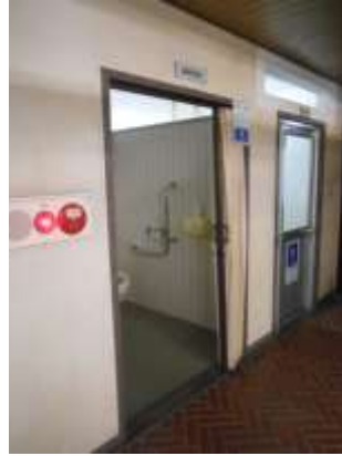
入口のアコーディオンドア