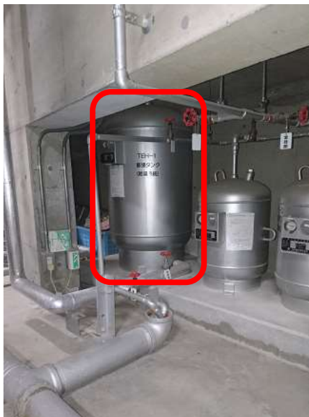
写真 1 : 給湯用密閉式膨張タンク設置場所