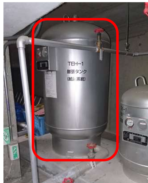
写真 2 : 給湯用密閉式膨張タンク正面