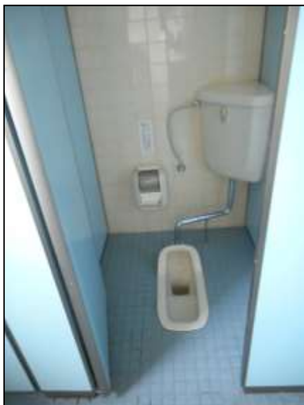
写真1：男子トイレ最奥全景