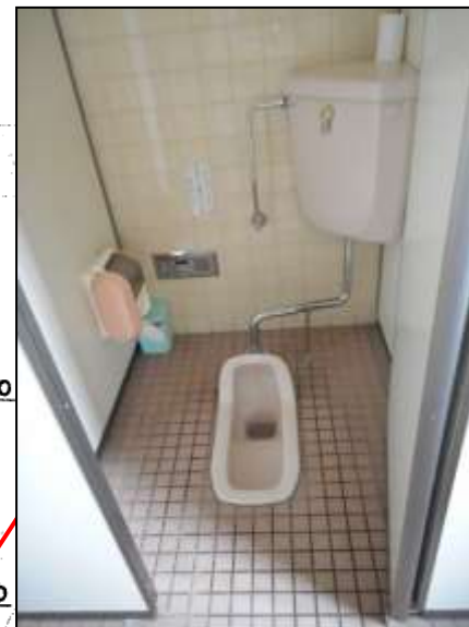
写真2：女子トイレ最奥全景